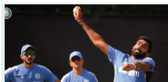
మెగా టోర్నీకి టీమిండియా రె'ఫీ' నేడు బంగ్లాదేశ్తో వార్మ్ పోరు