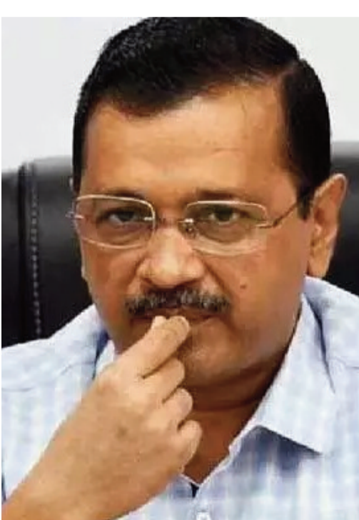
జైలులో చిత్రహింసలు పెట్టారు

ఢిల్లీ: మరో రెండు రోజుల్లో జైలుకు వెళుతున్నానని, ఈ సారి జైల్లో ఎంతకాలం ఉంచుతారో తెలియదు. కానీ నేను వచ్చే వరకు పథకాలన్నీ కొనసాగుతాయని ఢిల్లీ సీఎం కేజ్రీవార్ అన్నారు. సోషల్ మీడియా వేదికగా వీడియో విడుదల చేసిన ఆయన ప్రజలకు సందేశం ఇచ్చారు. ఆయన మాట్లాడుతూ.. ఎన్నికల ప్రచారానికి సుప్రీంకోర్టు నాకు 21 రోజుల సమయం ఇచ్చిందని, అది ముగియడంతో ఎల్లండి నేను తిరిగి తీవర్ జైలుకు వెళ్తాను అని చెప్పారు. ఈసారి నన్ను ఈ సారి ఎంతకాలం జైలులో ఉంచుతారో నాకు తెలియదు. కానీ నియంతృత్వం నుండి దేశాన్ని రక్షించడానికి జైలుకు వెళుతున్నందుకు గర్వపడుతున్నాను.