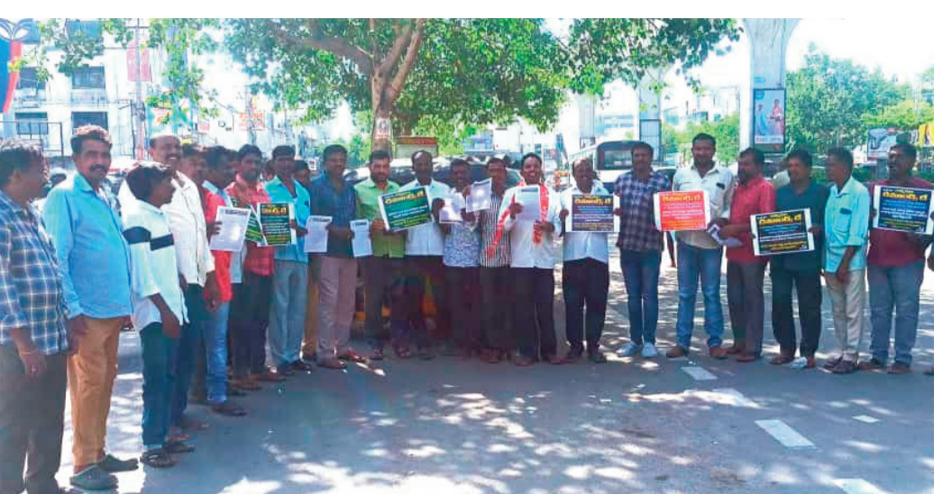
స్త్రీలను కార్మికులుగా గుర్తించి చట్టాలు అమలు చేయాలి ఆశావర్ధకు పరిక్షలు రద్దు చేయాలి అని కేంద్ర రాష్ట్ర ప్రభుత్వాలను డిమాండ్ చేశారు. ఈ కార్యక్రమాల్లో ఆశా వర్ధులు, అంగన్వాడీ, మధ్యాహ్నం భోజనం, భవన నిర్మాణ కార్మికులు, మున్సిపల్ కార్మికులు, ఆటో ట్రాన్స్పోర్ట్ కార్మికులు, వివిధ కార్మికులు పాల్గొన్నారు.