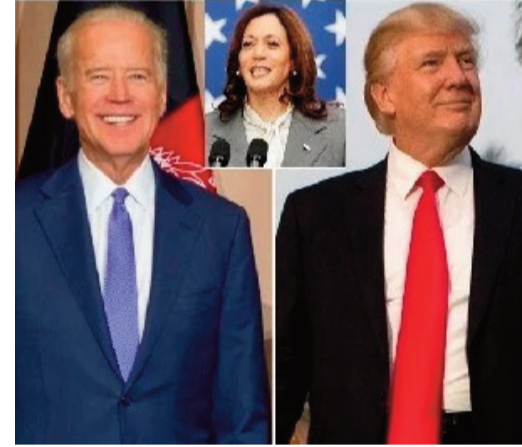
అమెరికా అధ్యక్ష రేసులో డెమోక్రటిక్ పార్టీ నుంచి జో బైడెన్, రిపబ్లికన్ పార్టీ నుంచి డొనాల్డ్ ట్రంప్ రేసులో ఉండడం తెలిసింది.

వాషింగ్టన్: ఈ ఏడాది నవంబరులో అమెరికా అధ్యక్ష ఎన్నికలు జరగనున్నాయి. ఎన్నికలు సమీపిస్తున్న కొద్దీ మాజీ అధ్యక్షుడు డొనాల్డ్ ట్రంప్ మాటల దాడిలో తీవ్రత పెంచుతున్నారు. తాజాగా, దేశాధ్యక్షుడు జో బైడెన్ ను ఉద్దేశించి ఆసక్తికర వ్యాఖ్యలు చేశారు. వంకర బుద్ధి జో బైడెన్ ను ఓ అంశంలో మెచ్చుకోవాలి.. బైడెన్ తన జీవితంలో తీసుకున్న అద్భుతమైన నిర్ణయం ఏదైనా ఉందంటే అది కమలా హ్యారీస్ ను ఉపాధ్యక్ష అభ్యర్థిగా ఎంచుకోవడమేనని ఎద్దేవా చేశారు. “బైడెన్ కు కమలా హ్యారీస్ ఓ ఇన్సూరెన్స్ పాలసీ వంటిది. ఉపాధ్యక్ష అభ్యర్థిగా సగం సమర్థుడై ఎన్నుకున్నా ఈపాటికి బైడెన్ ను సాగనంపేవారు... కానీ కమల్ హ్యారీస్ ఉపాధ్యక్షురాలిగా ఉండడంతో బైడెన్ బతికిపోయాడు” అంటూ ఇద్దరినీ కలిపి విమర్శించారు. అధ్యక్ష ఎన్నికల ప్రచారంలో భాగంగా జూన్ 27న జరిగిన డిజిట్ లో బైడెన్ పేలవ ప్రదర్శన సొంత పార్టీ (డెమోక్రటిక్ పార్టీ)లోనే విమర్శలకు దారితీసింది. ఈ నేపథ్యంలో ట్రంప్ తాజా వ్యాఖ్యలు ప్రాధాన్యత సంతరించుకున్నాయి.