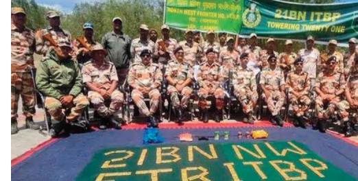
కొన్ని రకాల చైనీస్ ఆహార పదార్థాలు, కేక్ లు, పాలు స్వాధీనం చేసుకున్నారు. బటిబీపీ బలగాలు చూసి స్వగర్ల పారిపోయే ప్రయత్నం చేయగా, వెంటాడి పట్టుకున్నారు.