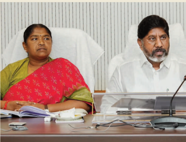
హైదరాబాద్, ప్రజానావ :

రాష్ట్రంలోని ప్రతి నియోజకవర్గంలో ఆంబేద్కర్ నాలెడ్డ్ సెంటర్లను ప్రారంభించనున్నట్లు డిప్యూటీ సీఎం మల్లు భట్టి విక్రమార్క ఆన్వయం. ఇనవిచాలయంలో మంత్రి సీతక్కతో కలిసి బడ్జెట్ సవరించే సమావేశం నిర్వహించారు. ఈ సందర్భంగా ఆయన మాట్లాడుతూ పోటీ పరిక్షల కోవింగ్కు నిపుణులైన వారితో ఉచితంగా గ్రామీణ యువతకు శిక్షణ ఇప్పిస్తామన్నారు. నాలుగు నెలల్లో ఈ నాలెడ్డ్ సెంటర్ల నిర్మాణాలు పూర్తవుతాయన్నారు. గ్రామీణ ప్రాంతాల్లో నిరుద్యోగ యువతకు ఉపాధి కల్పించే అంశాన్ని సీరియస్ గా తీసుకోవాలన్నారు. యువత ఉపాధి లేక ఇబ్బందులు పడుతున్నారన్నారు. ఫీజు రీయింబర్స్మెంట్ పథకం అందుబాటులోకి వచ్చాకీ వేలాది మంది బీటెక్ పూర్తి చేసి స్కీల్స్ లేక గ్రామాల్లోనే ఉండిపోతున్నారన్నారు. గ్రామీణాభివృద్ధి శాఖ ఆధ్వర్యంలో కొనసాగుతున్న స్కీల్ డెవలప్మెంట్ సెంటర్లను పాత ఉమ్మడి జిల్లా కేంద్రాల్లో ఏర్పాటు చేయాలని ఆదేశించారు. మిషన్ భగీరథ పథకం పనితీరుపై ఈ నెల 15 వరకు నివేదిక ఇవ్వాలని