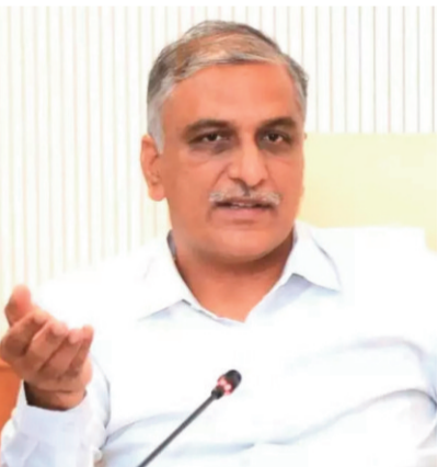
డి పరిష్కరించుకుందామని తెలిపారు. చావు సమస్య పరిష్కారానికి మార్గం కాదని అన్నారు.