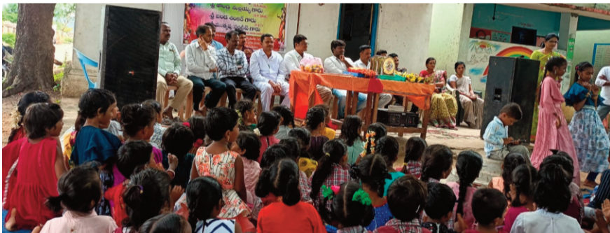
- చంద్రుర్, ప్రజానావ్