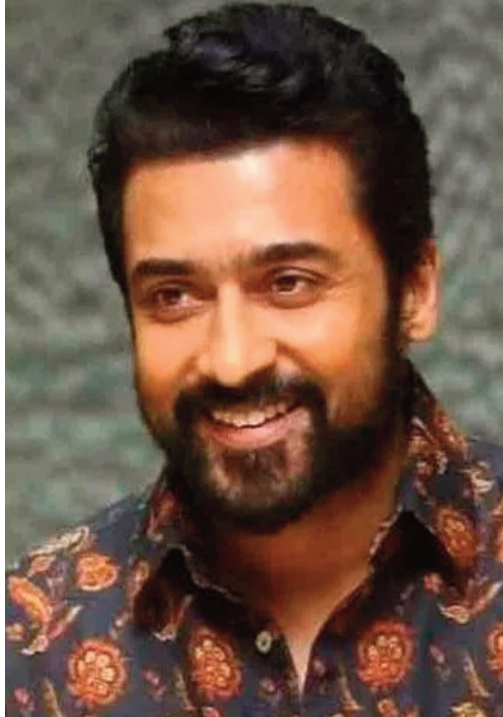
కోలుకున్నాడు. ఆందోళన చెందొద్దంటూ విజ్ఞప్తి చేశారు.