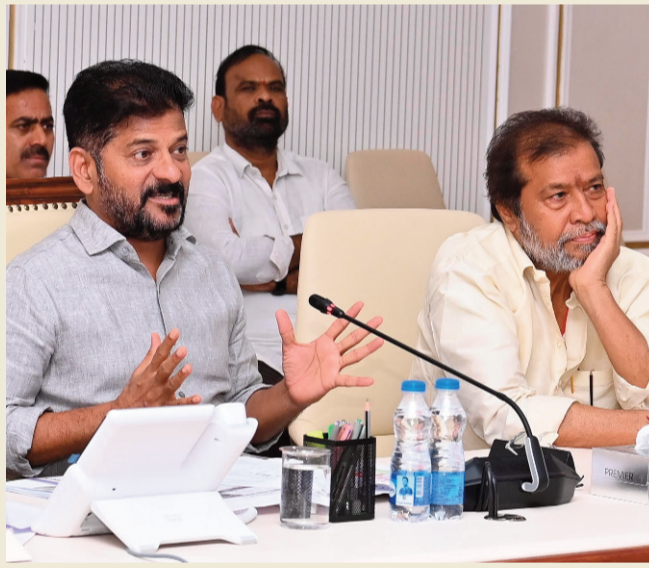
హైదరాబాద్ బ్యూరో, ప్రజానావ:

తెలంగాణ రాష్ట్ర ప్రభుత్వం మరో కీలక నిర్ణయం తీసుకుంది. ప్రభుత్వం ఏర్పాటు చేసిన ప్రజాపాలన దరఖాస్తులు స్వీకరించిన సర్కార్.. ఇప్పుడు మరో దరఖా ప్రజా పాలన కార్యక్రమం నిర్వహించేందుకు సిద్ధమైంది. రేషన్ కార్డు, హెల్త్ కార్డుల కోసం వివరాలు సేకరించనుంది. పూర్తి హెల్త్ ప్రొఫైల్తో రాష్ట్రంలో ప్రతి పౌరుడికి హెల్త్ కార్డు మంజూరు చేయాలని భావిస్తోంది. ఇందుకు సంబంధించి క్షేత్రస్థాయిలో అధికారులను సన్నద్ధం చేయాలని సీఎం రేవంత్ రెడ్డి ఆదేశించారు. ఈ మేరకు మంగళవారం నాడు స్పీడ్ (స్పాల్డ్ ప్రోయాక్టివ్ ఎఫిషియెంట్ అండ్ ఎఫెక్టివ్ డెలివరీ)పై అధికారులతో సీఎం సమావేశమయ్యారు. ఈ భేటీలో అధికారులకు సీఎం కీలక సూచనలు, సలహాలు ఇచ్చారు. సెప్టెంబర్ 17వ తేదీ నుంచి పది రోజుల పాటు మరోసారి ప్రజాపాలన కార్యక్రమం చేపట్టాలని ఆదేశించారు. ఇందుకు అవసరమైన చర్యలు చేపట్టాలని అధికారులకు సూచించారు. ఇకపై రేషన్ కార్డులు, హెల్త్ కార్డులకు లింక్ ఉండదని, వేర్వేరుగా కార్డులు జారీ చేస్తామని సీఎం చెప్పారు. ప్రజా పాలనలో ప్రతి కుటుంబం నుంచి అందుకు అవసరమైన వివరాలను సేకరిస్తామన్నారు. రాష్ట్రమంతటా అన్ని గ్రామాలు, వార్డుల్లో ప్రజా పాలన కార్యక్రమానికి నిర్వహించేందుకు అవసరమైన ఏర్పాట్లు చేసుకోవాలని ముఖ్యమంత్రి అధికారులను ఆదేశించారు. మంగళవారం సచివాలయంలో ముఖ్యమంత్రి ఎ.రేవంత్ రెడ్డి, మంత్రి రామోదర రాజనర్సింహతో కలిసి అధికారులతో సమీక్షా సమావేశం నిర్వహించారు. ప్రభుత్వ ప్రధాన కార్యదర్శి శాంతికుమారి, వైద్యారోగ్య శాఖ ముఖ్య కార్యదర్శి దాక్టర్ క్రిష్టినా చౌగటా, మున్సిపల్ శాఖ ముఖ్య కార్యదర్శి దాన్ కిశోర్, సీఎం ముఖ్య కార్యదర్శి శేషాద్రి ఈ సమావేశంలో పాల్గొన్నారు. హెల్త్ డిజిటల్ కార్డుల జారీకి ఎలాంటి పద్ధతి అనుసరించాలి. ప్రతి ఒక్కరి