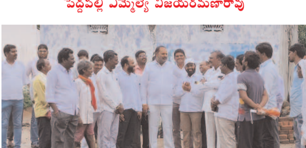
ఓడెల, ప్రజానావ :

ఓడెల మండల కేంద్రంలో డబుల్ బెడ్రూమ్ ఇండ్ల పనిసారాలను పరిశీలించి మౌలిక సౌకర్యాల కల్పన కోసం అధికారులు అంపన వేసి త్వరగా నివేదికను అందించాలని పెద్దపల్లి ఎమ్మెల్యే చింతకుంట విజయరమణ రావు అధికారులను ఆదేశించారు. ఎమ్మెల్యే చింతకుంట విజయరమణ రావు ఓడెల మండలంలో సోమవారం పర్యటించారు. ఓడెల రైతు వేదికను సంరక్షించారు. రైతు రుణమాఫీ కౌన్సిల్ వారి కోసం ప్రత్యేకంగా ఏర్పాటు చేసిన హెల్ప్ లైన్ సెంటర్ ని వ్యవసాయ అధికారులతో కలిసి పరిశీలించారు. ఈ సందర్భంగా