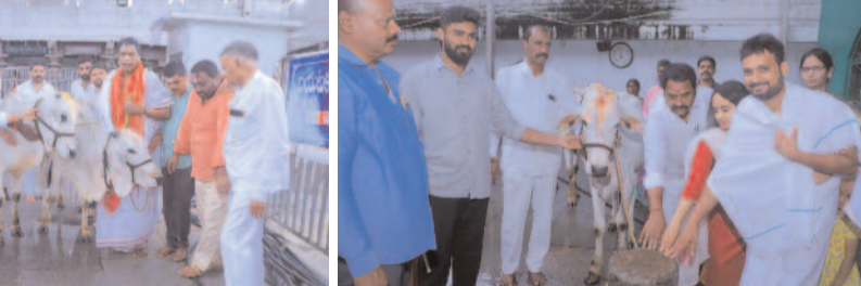
వేములవాడ, ప్రజానావ :