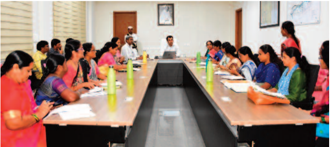
నిరిసిల్ల, ప్రజానావ :