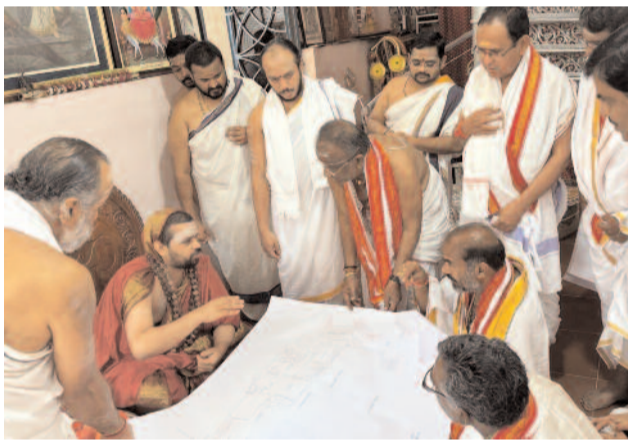
వేములవాడ, ప్రజానావ :

శృంగేరి పీఠాధిపతి భారతీస్వామిని కలిసిన ప్రభుత్వ వివ్ ఆది