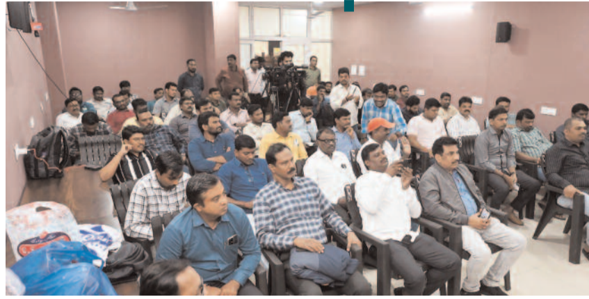
హైదరాబాద్, ప్రజానావ :

సందర్భంగా ఆయన కోరారు. కొందరు జర్నలిస్టులు తాము ఎలాంటి హాసింగ్ సాస్టెటిలలో సభ్యులుగా లేమని తమ పరిస్థితి ఏంటని అందోహసన చెందుతున్న విషయం తన దృష్టికి వచ్చిందని చెప్పారు. నిబంధనల మేరకు వర్సింగ్ జర్నలిస్టుగా పనిచేస్తున్న ప్రతి ఒక్కరికీ అక్రిడిటేషన్ లతో సంబంధం లేకుండా, సాస్టెటిలలో సంబంధం లేకుండా దరఖాస్తులు ప్రభుత్వం స్వీకరిస్తుందని స్పష్టం చేశారు. జర్నలిస్టుల సమస్యల పరిష్కారంలో యూనియన్ కీలక పాత్ర పోషిస్తుందని ఆయన తెలిపారు. గతంలో జర్నలిస్టులకు జూబ్లీ హిల్స్, బంజారాహిల్స్, గోపనపల్లిలో ఇళ్ల స్థలాలు వచ్చాయన్న అక్రిడిటేషన్ సౌకర్యం వచ్చిందంటే అది కేవలం యూనియన్ చేసిన పోరాటాలే అని, ఇందుకు