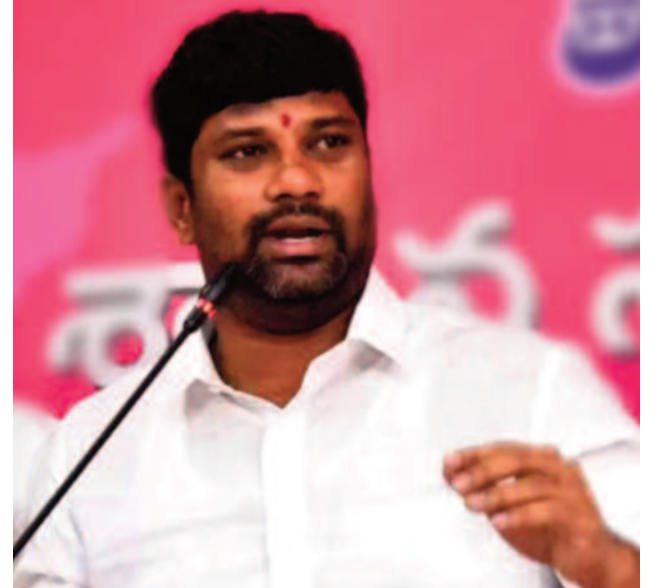
హైదరాబాద్, సెప్టెంబర్ 18:

సిని నటుడు అక్కినేని నాగార్జున రూ. 400 కోట్లు అడిగితే ఇవ్వనందుకే ఎస్ కన్వెన్షన్ కూలగొట్టారని బీఆర్ఎస్ నాయకుడు, మాజీ ఎమ్మెల్యే బాల్య సుమన్ సంచలన ఆరోపణలు చేశారు. బుధవారం ఆయన తెలంగాణ భవన్లో విరిడియా సమావేశంలో మాట్లాడారు. ఎఫ్టీవీల్ జోన్లో ఉందని నాగార్జునకు సంబంధించిన ఎస్ కన్వెన్షన్ను కూలగొట్టారు. అయితే హిమాయత్ సాగర్లో ఆనంద కన్వెన్షన్ ఉంది. ఎస్ కన్వెన్షన్ కూలగొట్టిన ఈ మొగ్గు, సిఫాయి, హైదరాబాద్లోని చెరువులను రక్షించే రక్షణ రేవంత్ రెడ్డి ఆనంద కన్వెన్షన్ను ఎందుకు కూలగొట్టడం లేదని ప్రశ్నించారు. ఇండస్ట్రీలో నడుస్తున్న టాక్ ఏంటంటే నాగార్జున రూ. 400 కోట్లు ఇవ్వనందుకే కూల్చివేస్తున్నారనే చర్చ జరుగుతుందన్నారు. ఆనంద కన్వెన్షన్ వాళ్లు ముడుపులు ముట్ట చెప్పినందుకే కూల్చలేదని ఆరోపించారు.