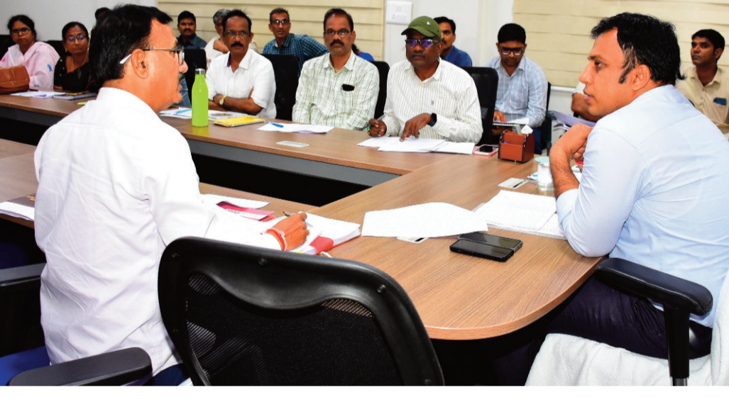
చేసిన పనులకు సంబంధించి యూటిలైజేషన్ సర్టిఫికెట్లను విద్యాశాఖ అధికారి, ఏరియా ఆఫీసర్ అధికారి, సంబంధిత అధికారులు వెంటనే సమర్పించాలని కలెక్టర్ ఆదేశించారు. నియోజకవర్గ అభివృద్ధి పనులకు సంబంధించి ప్రస్తుత స్థితిగతుల పట్ల సంబంధిత శాఖలు