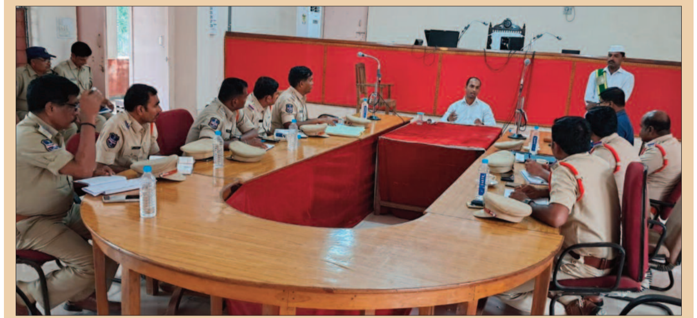
లోక్ అదాలత్ లో ఎక్కువ కేసులు పరిష్కారం అయ్యేలా చూడండి ఉధ్యమ కేరటం, సిర్సూర్(టీ): సిర్సూర్(టీ) సివిల్ కోర్టులో ఈ నెల 28న జాతీయ లోక్ అదాలత్ నిర్వహిస్తున్నట్లు న్యాయమూర్తి అజయ్ తెలిపారు. సోమవారం పోలీసు ఉన్నతాధికారులతో ప్రత్యేక సమావేశం నిర్వహించారు. ఈ సందర్భంగా ఆయన మాట్లాడారు. దీనిని కక్షిదారులు సద్వినియోగం చేసుకోవాలని నూచించారు. లోక్ అదాలత్ ఎక్కువగా కేసులు పరిష్కారం అయ్యేలా చూడాలని పోలీస్ శాఖకు తెలిపారు. ఈ సమావేశంలో డిఎస్పీలు, సీఐలు, ఎస్సీలు తదితరులు పాల్గొన్నారు.