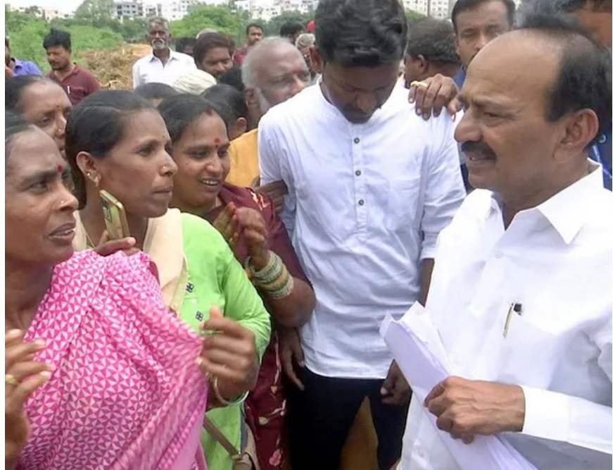
ప్రజానావ, హైదరాబాద్ ఎస్ఐటీఎల్ పరిధిలో ఉండేవి మొత్తం ప్రభుత్వ భూములు కావని, పట్టా భూములు కూడా ఉంటాయని తెలిపారు. కాంగ్రెస్ ప్రభుత్వం కూల్చివేస్తున్నవి అన్ని అక్రమ నిర్మాణాలు కావని, హైద్రా పేరుతో డబ్బులు వసూలు చేసే కార్యక్రమం జరుగుతోందని మిగతా 2లో..

హైద్రా పేరుతో డబ్బులు వసూలు చేస్తుండ్రు పేదలనే టార్గెట్ చేసి ప్రభుత్వం హీనంగా ప్రవర్తిస్తోంది కూల్చివేతలతో పేదలంతా రోడ్డున పడ్డారు వారికి తక్షణమే ప్రభుత్వం పరిహారం చెల్లించాలి ఖమ్మం పర్యటనలో ఎంపీ ఈటల