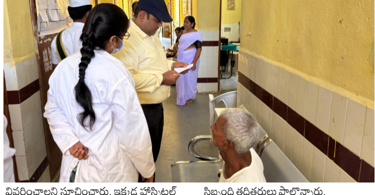
వివరించాలని సూచించారు. ఇక్కడ హాస్పిటల్ సిబ్బంది తదితరులు పాల్గొన్నారు.