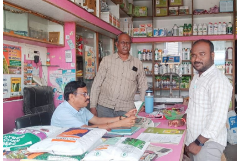
ప్రజానావ, దౌల్తాబాద్ :