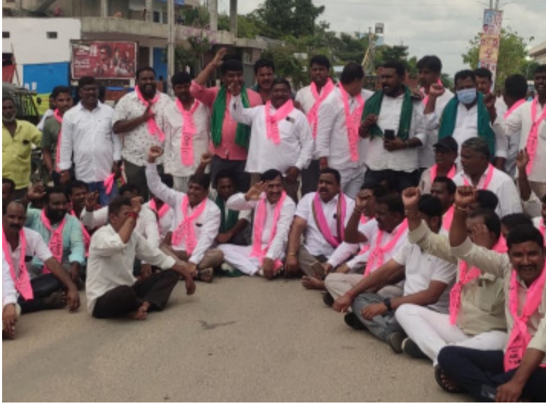
ప్రజానావ, మెదక్ బ్యారీ: