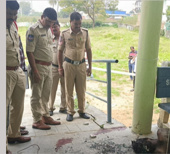
ప్రజానావ, చిన్న శంకరంపేట: