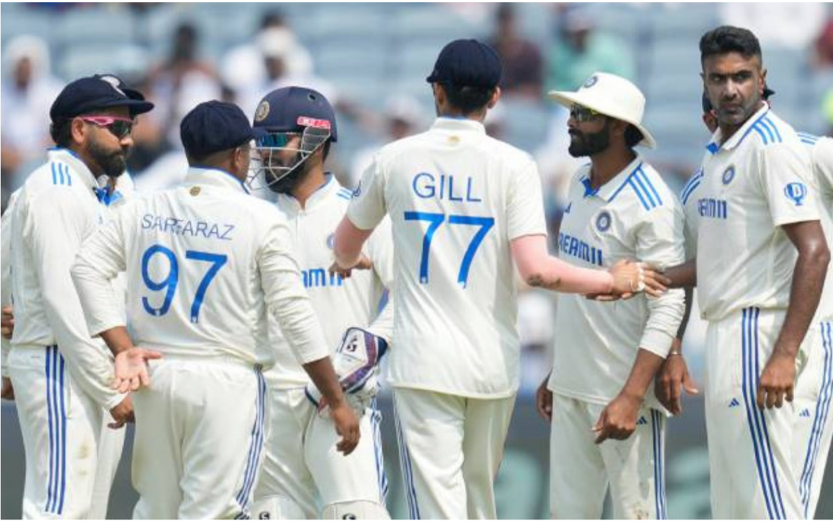
వెల్లడించారు. సినియర్లదే బాధ్యత... దీక్ష "బ్యాటింగ్ లో సీనియర్లు చేతులెత్తేశారు. బౌలింగ్ లో అశ్వినీ, రవీంద్ర జడేజా ఇంకా సుమర్ గా ప్రదర్శన చేస్తే బాగుండేది. కాబట్టి, ఈ ఓటమికి వారే

ప్రధాన కోచ్ గా బాధ్యతలు చేపట్టిన గౌతమ్ గంభీర్ కు సందేహం తొలి సిరీస్ ఓటమి పెద్ద షాక్. దాదాపు 12 ఏళ్ల తర్వాత ఓటమి అనిపించిన టెస్టు సిరీస్ కూడా ఇదే. న్యూజిలాండ్ తో సిరీస్ 0-2 తేడాతో కోల్పోయిన భారత్ మాజీ మాస్టర్ బ్యాట్ కోచ్ సన్నద్ధమవుతోంది. రెండో టెస్టులో స్పిన్ ట్రాక్ సిద్ధం చేసుకొని మరీ ఓడిపోవడం అభిమానులు బాధించింది. స్ట్రాక్ ఫ్లేయర్లు రోహిత్, విరాట్ కోల్హా, గిల్ వైఫల్యం కొట్టిబిచ్చుతున్నాయి. కోచ్ గా గంభీర్ పైన సోపర్ మీడియాలో విమర్శలు వచ్చాయి. జట్టును నడిపించడంలో సరైన ప్రణాళికలు పాటించడం లేదంటూ కామెంట్లు వచ్చాయి. వీటిపై భారత మాజీ క్రీకెటర్లు దినేశ్ కార్నిక, సంజయ్ మండ్రే కర్ స్పందించారు. జట్టు అటువైపు ప్రభావం చాలా తక్కువనీ.. ఆటగాళ్లదే ఎక్కువ బాధ్యత ఉంటుందని వ్యాఖ్యానించారు. "కెపిఎతో సిరీస్ ఓడిపోగానే.. భారత ప్రధాన కోచ్ గౌతమ్ గంభీర్ పై నెపం మోపేందుకు మాస్టర్లు.. నేనైతే అలాంటి వ్యాఖ్యలు అప్పులు చేయను. మైదానంలో దిగాక జట్టు ప్రదర్శన పై కోచ్ ప్రభావం చాలా తక్కువ. పుణె బిస్మిల్ కి యవ ఆల్ రౌండ్ర్ వాషింగ్టన్ సుందర్ ను తీసుకుని మంచి పని చేశారు. కానీ, రెండో ఇన్నింగ్స్ లో సర్పరాజ్ ఖాన్ కంటే ముందు అతడిని పంపడంలో తప్పు తెలివి ప్ర దర్శిస్తే బాగుండేది. మిగతా బ్యాటర్లూ దారుణంగా విఫలం కావడంతో ఓటమి తప్పలేదు. దీనికి కోచ్ ను బాధ్యుడిని చేయడం పొరపాటే. గెలుపొటముద్ కోచ్ కంటే ఫ్లేయర్లదే తీలక పాత్ర" అని సంజయ్