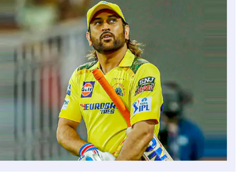
ఉండడానికి ఇది నాకు ఉపయోగపడుతుంది. కోరుకున్న ఆహారాన్ని తింటా. ట్రైనింగ్ మొదలైతే ఆహార నియంత్రణ పాటిస్తా" అని ధోని అన్నాడు. మరోవైపు ధోని మరో సీజన్కు సిద్ధంగా ఉండడం ప్రణాళిక అవసరం. కానీ అదే సమయంలో సరదాగానూ గడపాలి. నా ప్రణాళిక సరళంగా ఉంటుంది. 15, 20, 25 రోజులు సాధన చేస్తా. ఆ తర్వాత 1520 రోజులు విశ్రాంతి తీసుకుంటా. యల్లో

చెన్నై: వచ్చే ఏడాది ఐపీఎల్ లో ధోని ఆడడంపై నెలకొన్న అనిపింపు తొలగిస్తే.. 2025 సీజన్ లో తాను ఆడబోతున్నట్లు అతడు సూచనలు చేస్తాడు. "నా క్రికెట్ కెరీర్లో చివరి కోసానే ధోనిని ఆహ్వానించాలనుకుంటున్నా. క్రికెట్ లాంటి ప్రాజెక్టులో క్రీడను ఆడుతున్నప్పుడు ఒక ఆటగానిగా ఆహ్వానించడం కష్టం. కానీ నేను ఆలా ఆహ్వానించాలని అనుకుంటున్నా. తేలిక కాదు. భావోద్వేగాలు కలుగుతూనే ఉంటాయి" అని ఓ కార్తీక మంలో ధోని వ్యాఖ్యానించాడు. "రెండున్నర నెలలు పాటు ఐపీఎల్ ఆడాలంటే నేను తొమ్మిది నెలలు ఫిట్ నెనను కావాలి. అందుకు ప్రణాళిక అవసరం. కానీ అదే సమయంలో సరదాగానూ గడపాలి. నా ప్రణాళిక సరళంగా ఉంటుంది. 15, 20, 25 రోజులు సాధన చేస్తా. ఆ తర్వాత 1520 రోజులు విశ్రాంతి తీసుకుంటా. యల్లో