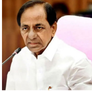
తనిఖీలు ఆపాలని డిజిపీని కోరారు. - బీఆర్ఎస్ అధినేత కేసీఆర్