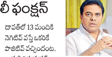
దావత్లో 13 మందికి నెగిటివ్ వస్తే ఒకరికే పాజిటివ్ వచ్చిందంటుంది. ఆ వ్యక్తి ఎక్కడ డ్రగ్స్ తీసుకున్నారో విచారించాలి. కాంగ్రెస్, బీజేపీ రెండు పార్టీలు కూడా బలం కలిగి ఉన్నాయి. నా బావమరిదికి డ్రగ్స్ దొస్తారే నెగిటివ్ వస్తుంది. - బీఆర్ఎస్ వర్కర్స్ సెనియర్ కేటీఆర్