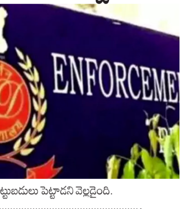
పెట్టుబడులు పెట్టాడని వెల్లడైంది.

తెలంగాణ, ఆంధ్రప్రదేశ్, కర్ణాటక, ఒడిశా, అండమాన్ లో కేసులు నమోదయ్యాయి. 32 లక్షల ఖాతాదారుల నుంచి రూ. 6,380 కోట్లను వసూలు చేసినట్లు దర్యాప్తులో ఈడీ గుర్తించింది. దీంతో అగ్రికోల్డ్ కు చెందిన రూ. 4,141 కోట్ల ఆస్తులను ఈడీ అటాచ్ చేసింది. ఈ కేసులో ఈడీ ఇప్పటికే 14 మందిని అరెస్ట్ చేసింది. 130 వెల్ కంపెనీల ద్వారా నిధులు బదిలాయించినట్లు గుర్తించింది. అగ్రికోల్డ్ డబ్బులను ఎంపీ వెంకటరామారావు ఇతర ఖాతాలకు మళ్లించాడని, మళ్లించిన నిధులతో పవర్, రియల్ ఎస్టేట్, ఎంటర్ప్రైజ్ మెంట్, ఫార్మారంగాల్లో