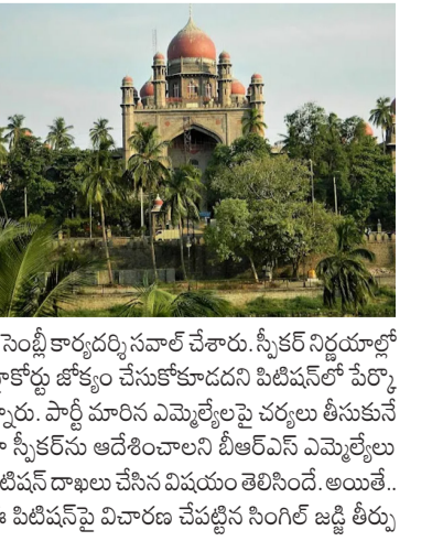
అసెంబ్లీ కార్యదర్శి నవాలి చేశారు. స్పీకర్ నిర్ణయాల్లో హైకోర్టు కోర్టుం చేసుకోవడంపై బీజేపీలో పేర్కొన్నారు. పార్టీ మారిన ఎమ్మెల్యేలపై చర్యలు తీసుకునే లా స్పీకర్ ను ఆడిశించాలని బీఆర్ఎస్ ఎమ్మెల్యేలు పిటిషన్ దాఖలు చేసిన విషయం తెలిసింది. అయితే... ఈ పిటిషన్లపై విచారణ చేపట్టిన సింగిల్ జడ్జి తీర్పు