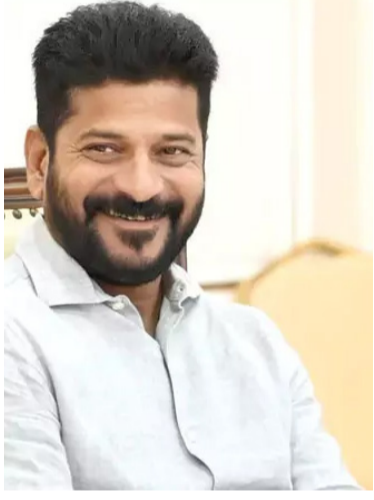
మాట్లాడనున్నారు. అనంతరం హైదరాబాద్ కి తిరుగు ప్రయాణం కానున్నారు.

రేవంట్ రెడ్డి పర్యటనలో పాల్గొనున్నారు. సీఎంకు సంబంధించిన యాత్ర షెడ్యూల్... శుక్రవారం ఉదయం 9 గంటలకు బేగంపేట్ నుంచి హెలికాప్టర్ లో ముఖ్యమంత్రి రేవంట్ రెడ్డి యాదగిరిగుట్టకు బయలుదేరారు. 10 గంటలకు లక్ష్మీ నరసింహస్వామి దర్శనం, పూజ కార్యక్రమంలో పాల్గొనున్నారు. అనంతరం 11.30కు యాదగిరి గుట్ట వైపులో డెవలప్మెంట్ అథారిటీ, అలయ అధిపతి కార్యకలాపాలపై ముఖ్యమంత్రి సమీక్ష చేపట్టనున్నారు. 1.30కి రోడ్డు మార్గంలో సంగం వెళ్లి, అక్కడి నుంచి మూసీ నది పునరుజ్జీవన సంకల్ప యాత్ర చేపట్టనున్నారు. మూసీ నది కుడి ఒడ్డున భీమంగం వరకు దాదాపు 2.5 కిలో మీటర్ల పాదయాత్ర చేపట్టనున్నారు ముఖ్యమంత్రి రేవంట్ రెడ్డి. అక్కడి నుంచి ధర్మారెడ్డిపల్లి కెనాల్ కట్ట వెంబడి సంగం - నాగిరెడ్డిపల్లి రోడ్డు వరకు పాదయాత్ర చేపట్టనున్నారు. అక్కడే యాత్రను ఉద్దేశించి మూసీ పునరుజ్జీవ సంకల్ప రథంపై నుంచి ముఖ్యమంత్రి