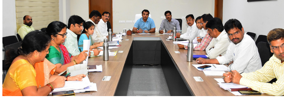
జిల్లాలో 26 శాతం సర్వే పూర్తి సమగ్ర ఇంటింటి కుటుంబ సర్వే పై సంబంధిత అధికారులతో సమీకృత నిర్వహించిన జిల్లా కలెక్టర్ ప్రజానావ, నిలిసిల్ల:

ప్రభుత్వం చేపట్టిన సమగ్ర ఇంటింటి కుటుంబ సర్వే ప్రక్రియ జిల్లాలో సకాలంలో పూర్తి చేసేలా అధికారులు పటిష్ట కార్యాచరణ అమలు చేయాలని, ప్రతి రోజు నిర్దిష్ట లక్ష్యం మేరకు ఇండ్ల సర్వే జరగాలని జిల్లా కలెక్టర్ సందీప్ కుమార్ రు సంబంధిత అధికారులను ఆదేశించారు. మంగళవారం సమీకృత జిల్లా కలెక్టర్లలో జిల్లా కలెక్టర్ సందీప్ కుమార్ రు అదనపు కలెక్టర్ ఖిమ్మా నాయక్ లతో కలిసి సంబంధిత అధికారులతో సమగ్ర ఇంటింటి కుటుంబ సర్వే పై సమీకృత నిర్వహించారు. సిరిసిల్ల జిల్లాలో జరుగుతున్న సమగ్ర ఇంటింటి కుటుంబ సర్వే వివరాలు, ఎదురవుతున్న ఇబ్బందులు, చేపట్టాల్సిన చర్యలపై మండలాల వారీగా కలెక్టర్ సమీక్షించి పలు సూచనలు, ఆదేశాలు జారీ చేశారు.