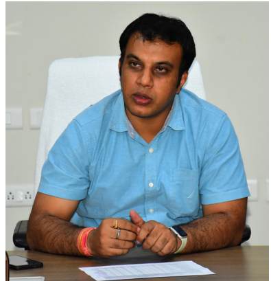
జిల్లా కలెక్టర్ సందీప్ కుమార్ రు మాట్లాడుతూ.

ప్రభుత్వం చేపట్టిన సమగ్ర ఇంటింటి కుటుంబ సర్వే ప్రక్రియ జిల్లాలో సకాలంలో పూర్తి చేసేలా అధికారులు పటిష్ట కార్యాచరణ అమలు చేయాలని, ప్రతి రోజు నిర్దిష్ట లక్ష్యం మేరకు ఇండ్ల సర్వే జరగాలని జిల్లా కలెక్టర్ సందీప్ కుమార్ రు సంబంధిత అధికారులను ఆదేశించారు. మంగళవారం సమీకృత జిల్లా కలెక్టర్లలో జిల్లా కలెక్టర్ సందీప్ కుమార్ రు అదనపు కలెక్టర్ ఖిమ్మా నాయక్ లతో కలిసి సంబంధిత అధికారులతో సమగ్ర ఇంటింటి కుటుంబ సర్వే పై సమీకృత నిర్వహించారు. సిరిసిల్ల జిల్లాలో జరుగుతున్న సమగ్ర ఇంటింటి కుటుంబ సర్వే వివరాలు, ఎదురవుతున్న ఇబ్బందులు, చేపట్టాల్సిన చర్యలపై మండలాల వారీగా కలెక్టర్ సమీక్షించి పలు సూచనలు, ఆదేశాలు జారీ చేశారు.