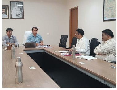
కలెక్టర్ అధ్యక్షతన నిర్వహణ ప్రజానావ, రాజన్న నిలిసిల్ల:

వేములవాడ ప్రాంతీయ ఆసుపత్రిలో వైద్యుల పోస్టుల భర్తీకి ఇంటర్వ్యూలు