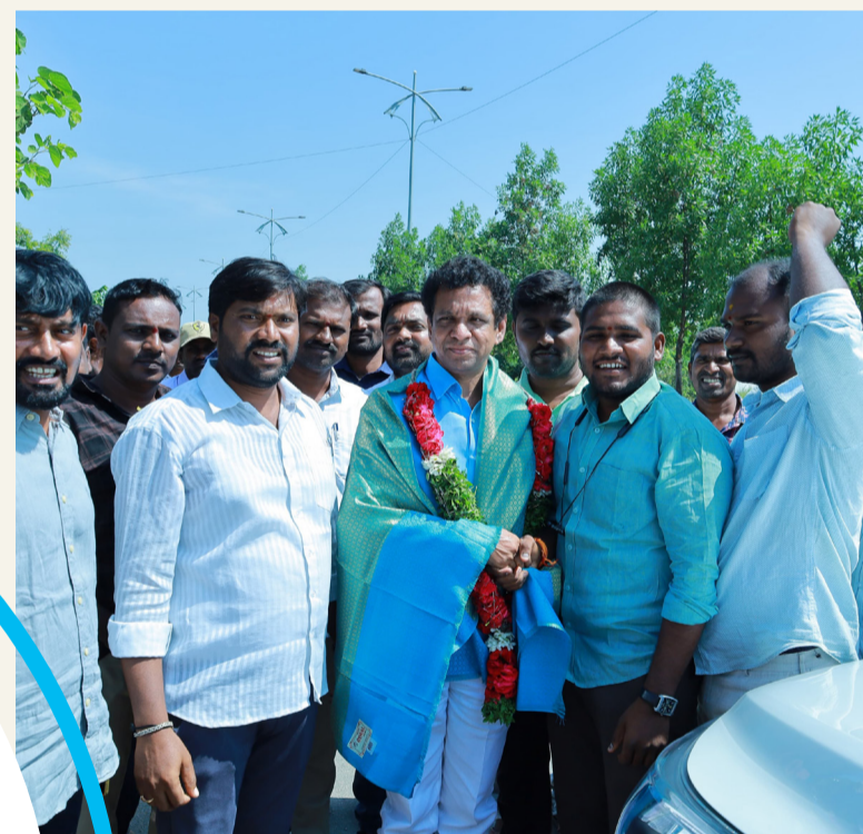
ఉపాధి అవకాశాల కల్పించడమే లక్ష్యంగా తాను ముందుకు సాగుతానని, ఎంతో శ్రమించి ఉన్నత చదువులు చదివిన వారికి కావ్యత మార్గాన్ని చూపించేందుకు బాసటగా నిలుస్తానన్నారు. నిరుద్యోగుల కోసం కరీంనగర్, ఆదిలాబాద్, నిజామాబాద్, మెదక్ జిల్లాల్లో స్కీల్ డెవలప్ మెంట్ కేంద్రాలను ఏర్పాటు చేస్తానని కూడా హామీ ఇచ్చారు.

ఉమ్మడి నాలుగు జిల్లా కేంద్రాల్లో ఉచిత కో-చింగ్ సెంటర్లు తెలంగాణ ప్రాంత విద్యార్థులు ఉన్నత విద్య కోసం ఆంధ్రా ప్రాంతానికి వెళ్ళ చదువుకోవడం కోసం పడుతున్న కష్టాలను చూసి కరీంనగర్, ఆదిలాబాద్, నిజామాబాద్, మెదక్ ఉమ్మడి జిల్లా కేంద్రాల్లో VNR ఫౌండేషన్ అధ్యక్షులలో నిరుద్యోగ యువత ఉచితంగా కో-చింగ్ సెంటర్లను ప్రారంభిస్తానన్నారు.. ప్రైవేట్ విద్యార్థుల అధ్యాపకులు, ఉపాధ్యాయులకు సైతం హెల్ప్ కార్డులు వచ్చేలా కృషి చేస్తానని, కాంట్రాక్టు ఉపాధ్యాయుల సమస్యలను పరిష్కరిస్తానని, ఓల్డ్ పెన్షన్ స్కీం తీసుకు వచ్చేలా ప్రత్యేకంగా కృషి