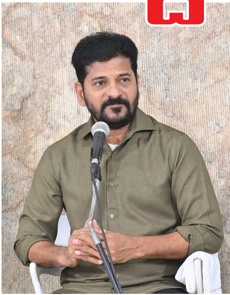
ప్రజానావ, హైదరాబాద్ బ్యూరో: 'దేశ వ్యాప్తంగా అదానీ వివాదం ముదురుతున్న నేపథ్యంలో సీఎం రేవంత్ రెడ్డి నంచలన నిర్ణయం తీసుకున్నారు. స్కిల్స్ యూనివర్సిటీకి అదానీ ప్రకటించిన రూ.100 కోట్ల విరాళాన్ని తిరస్కరించినట్లు ప్రకటించారు. ఈ మేరకు అదానీ సంస్థకు లేఖ రాశామన్నారు. అదానీ గ్రూప్ లంచాల ఆరోపణల నేపథ్యంలో తెలంగాణ ప్రభుత్వం కీలక నిర్ణయం తీసుకుంది. తెలంగాణ స్కిల్స్ యూనివర్సిటీకి మిగతా 2లో..