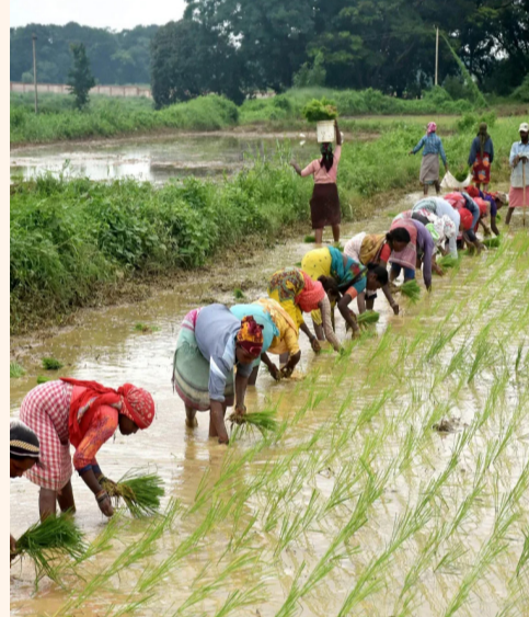
ప్రజానావ, హైదరాబాద్ బ్యూరో:

రైతు భరోసాపై ముఖ్యమంత్రి రేవంత్ రెడ్డి కీలక ప్రకటన చేశారు. మా ప్రభుత్వం రైతు భరోసా కొనసాగిస్తుంది.. సంక్రాంతి తర్వాత రైతుల ఖాతాల్లో రైతు భరోసా నిధులు వేసామని ముఖ్యమంత్రి పేర్కొన్నారు. మారీచుడు వచ్చి అడ్డు కున్నారైతే భరోసా ఆగదన్నారు. భట్టి విక్రమారావు ఆధ్వర్యంలో రైతుభరోసాపై కేబినెట్ సభకమిటీ వేశామని.. మా ప్రభుత్వం రైతు భరోసా కొనసాగిస్తుందని తెలిపారు. డిసెంబర్ లో జరిగే అసెంబ్లీ సమావేశాల్లో చర్చించి రైతు భరోసా వేస్తామని సీఎం రేవంత్ రెడ్డి స్పష్టం చేశారు. పాలమూరు జిల్లాలో రైతు పండుగ జరిగింది.. రైతులు ప్రభుత్వానికి గొప్ప శక్తి.. వారి ఆశీర్వాదం తో ఇంద్రం వచ్చిందని భావిస్తామన్నారు. ఏ జిల్లా అయితే నిండు మనస్సుతో ఆశీర్వదించిందో భవిష్యత్లో కూడా అలానే కొనసాగుతుందన్నారు. జూన్ 2, 2014 నాటికి 16 వేల కోట్ల మిగులు, 69 వేల కోట్ల