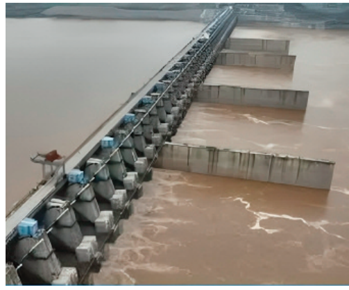
ఆదిత్యనాథ్ దాస్ పాల్గొన్నారు. ఈ సందర్భంగా అధికారులకు సీఎం కీలక ఆదేశాలు ఇచ్చారు. పోలవరం

నిరుమించాలన్నారు. భద్రాచలం ఆలయానికి ముప్పు ఏర్పడే అవకాశాలపైనే ఈ బృందం అధ్యయనం చేయనుంది. 2022లో వచ్చిన వరదల వల్ల భద్రాచలం ముంపునకు గురైనది, 27 లక్షల క్యూసెక్కుల వరద నీరు వచ్చిందని అధికారులు సీఎం దృష్టికి తసుకెళ్లారు. ఏపీ ప్రభుత్వం కొత్తగా బనకచర్ల ప్రాజెక్టు చేపడుతోందని.. ఆ ప్రాజెక్టుకు ఎలాంటి అనుమతులు లేవని అధికారులు సీఎంకు వివరించారు. తెలంగాణ అభ్యంతరాలను ఏపీ సీఎస్ కు తెలిపాలని, అవసరమైతే గోదావరి బోర్డు, కేంద్ర జలశక్తిశాఖకు లేఖలు రాయాలని సీఎం రేవంత్ రెడ్డి సూచించారు. ముఖ్యమంత్రి రేవంత్ రెడ్డి నీటిపారుదల శాఖ ఉన్నతాధికారులతో సమావేశమయ్యారు. ఈ సమావేశంలో నీటి పారుదల శాఖ మంత్రి ఉత్తమ్ కుమార్ రెడ్డి, రాష్ట్ర ప్రభుత్వ సలహాదారు (నీటి పారుదల శాఖ)