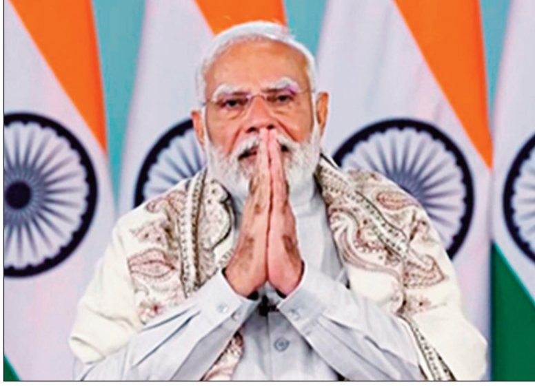
పరిరక్షించడాన్ని కొనసాగిద్దాం, వారి విద్యను నిర్ధారిద్దాం. కలిసికట్టుగా వారి కోసం ఎటువంటి వివక్ష లేకుండా అభివృద్ధి చెందగల సమాజాన్ని సృష్టద్దాం. రాబోయే రోజుల్లో మన దేశ కుమార్తెలకు గొప్ప పురోగతిని, అవకాశాలను వస్తాయో' అని మోదీ అన్నారు.

న్యూఢిల్లీ, జనవరి 22: ప్రధాని సరేంద్రమోదీ ప్రారంభించిన 'బేటీ బచావో, బేటీ పడావో' కార్యక్రమం నేటితో పదేళ్లు పూర్తి చేసుకుంది. ఈ విషయాన్ని గుర్తు చేస్తూ ప్రధాని సరేంద్ర మోదీ బుధవారం సోషల్ మీడియా వేదికగా కృతజ్ఞతలు తెలిపారు. 'నేటితో బేటీ బచావో, బేటీ పడావో ఉద్యమానికి పదేళ్లు పూర్తి అయ్యాయి. గత దశాబ్ద కాలంలో ఇది ఒక కీలక పరివర్తన, ప్రజల-ఆధారిత చొరవగా మారింది. అన్ని వర్గాల భాగస్వామ్యాన్ని పొందిందని' ప్రధాని మోదీ ఎక్స్ వేదికగా పోస్ట్ చేస్తూ ఆనందం వ్యక్తం చేశారు. లింగ అడ్డంకులు, పక్షపాతాలను అధిగమించడంపై ఈ ఉద్యమం దృష్టి సారించిందని, ఆడపిల్లలకు విద్య, అవకాశాలు ఉండేలా చూసేందుకు ఈ కార్యక్రమం మార్గం సుగమం చేసిందని ప్రధాని మోదీ అన్నారు. ఆడ పిల్లల లింగ నిష్పత్తులను సమతుల్యం చేయడం కోసం ప్రజలతోపాటు వివిధ కమ్యూనిటీ సంస్థలు చేపట్టిన ప్రయత్నాలకు, అంకిత భావానికి ప్రధాని మోదీ కృతజ్ఞతలు తెలిపారు. ప్రస్తుతం పిల్లల లింగ నిష్పత్తి తక్కువగా ఉన్న జిల్లాలు గణనీయమైన మెరుగుదలను సాధించాయని, అవగాహన ప్రచారాలు లింగ సమానత్వం, ప్రాముఖ్యతను తెలియజేయడంలో హితోదీకంగా తోడ్పడ్డాయన్నారు. దేశంలోని మహిళల హక్కులను కాపాడేందుకు, వారి విద్యకు భరోసా కల్పించేందుకు ఈ ఉద్యమాన్ని కొనసాగించాల్సిన అవసరం ఉందని ప్రధాని మోదీ పిలుపునిచ్చారు. 'ఈ ఉద్యమాన్ని కింది స్థాయి నుంచి ఉద్ధృతం చేసిన భాగస్వాములందరినీ అభినందిస్తున్నాను. మన కుమార్తెల హక్కులను