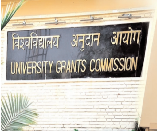
ఇంటర్నేషనల్ యూనివర్సిటీ యాక్ట్, 2016ను రద్దు చేస్తూ తీర్మానాన్ని ఆమోదించింది. 2016లో విశ్వవిద్యాలయం ప్రారంభమైనప్పటి నుంచి విద్యా కార్యకలాపాలను ప్రారంభించడంలో విఫలమైందని తీర్మానంలో హైలైట్ చేసింది. ఈ పరిణామాల నేపథ్యంలో జార్ఖండ్ చట్టంలోని సెక్షన్ 2 ప్రకారం గుర్తింపు పొందిన యూనివర్సిటీల జాబితా నుంచి యూజీసీ అధికారికంగా ప్రజ్ఞాన్ ఇంటర్నేషనల్ యూనివర్సిటీని తొలగించింది.

ప్రజ్ఞాన్ ఇంటర్నేషనల్ యూనివర్సిటీ చట్టం 2016 ప్రకారం ప్రజ్ఞాన్ ఇంటర్నేషనల్ యూనివర్సిటీ స్థాపించబడింది. 2016 ఆగస్టు 3న యూజీసీ జాబితాలో చేరింది. అయితే ప్రజ్ఞాన్ ఇంటర్నేషనల్ యూనివర్సిటీ యాక్ట్ 2016'ని 2024లో ఆ రాష్ట్ర ప్రభుత్వం రద్దు చేసింది. ఈ రిజల్యూషన్ ప్రకారం, ప్రజ్ఞాన్ ఇంటర్నేషనల్ యూనివర్సిటీ 2016 సంవత్సరంలో స్థాపించిన తర్వాత కూడా ఉనికిలోకి రాలేదు. అక్కడ బోధన జరుగుతున్నట్లు ఎలాంటి ఆధారాలు యూజీసీకి సమర్పించలేదు. పైగా యూజీసీ పంపిన టెలిఫోన్ కాల్లు, ఇమెయిల్ లకు యూనివర్సిటీ స్పందించలేదు. ఈ క్రమంలో జార్ఖండ్ ప్రభుత్వ హయ్యర్ అండ్ టెక్నికల్ ఎడ్యుకేషన్ డిపార్ట్ మెంట్ మార్చి 20, 2024న జార్ఖండ్ గెజిట్ లో.. ప్రజ్ఞాన్