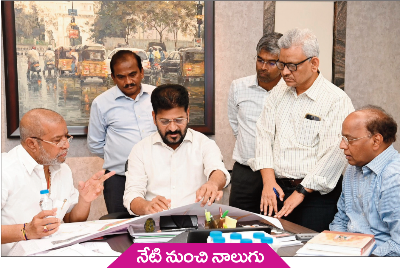
నేటి నుంచి నాలుగు