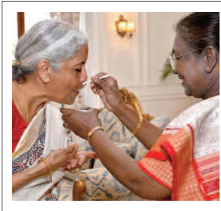
మగతా 2 లో

న్యూఢిల్లీ, ఫిబ్రవరి 1: వేతన జీవులకు ఊరట కలిగిస్తూ.. చిన్న తరహా పరిశ్రమలకు ప్రోత్సాహ మిస్తూ.. అన్నదాతలకు అండగా నిలిచేలా భరోసానిస్తూ.. కేంద్ర ఆర్థిక మంత్రి నిర్మలా సీతారామన్ కేంద్ర వార్షిక బడ్జెట్ 2025-26ను లోక్ సభలో ప్రవేశపెట్టారు. వైద్య విద్యార్థులకు తీపి కబురు అందించారు. మొత్తం రూ. 50,65,345 కోట్లతో 2025-26 ఏడాది కేంద్ర ప్రభుత్వ బడ్జెట్ను ప్రవేశపెట్టారు. ఈ బడ్జెట్లో ప్రధానంగా మధ్యతరగతి ప్రజానీకానికి భారీ ఊరట లభించింది. రూ. 12 లక్షలలోపు ఆదాయం ఉన్నవారికి పూర్తిగా పన్ను మినహాయింపు ఇస్తున్నట్లు కేంద్రం ప్రకటించింది. అలాగే రక్షణ శాఖకు అధికంగా నిధులు కేటాయించింది. లోక్ సభలో ఎనిమిదోసారి బడ్జెట్ను కేంద్రమంత్రి నిర్మలా సీతారామన్ ప్రవేశపెట్టారు. దేశమంత్రి మన్మథ్ కార్కే.. దేశమంత్రి మన్మథ్ కార్కే అన్న గురజాడ మాటలను ఉటంకిస్తూ.. బడ్జెట్ ప్రసంగం ప్రారంభించారు.