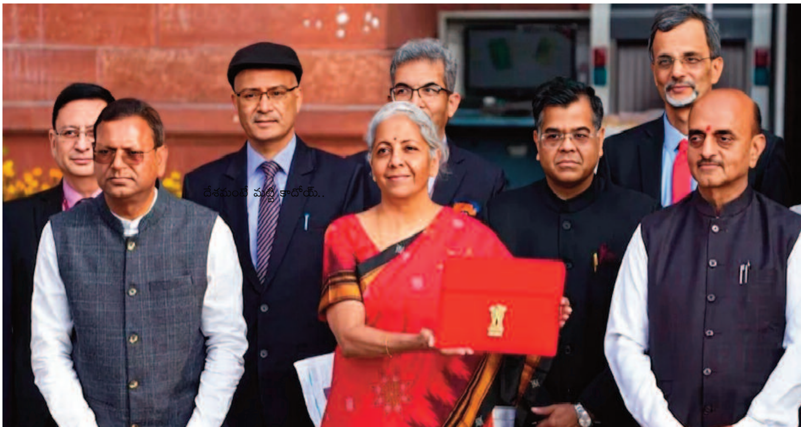
దేశమంత్రి మన్మథ్ కార్కే