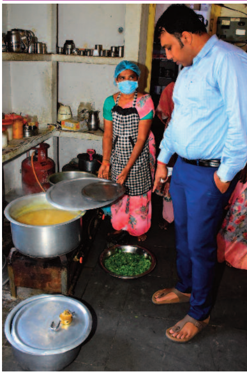
తరగతి గదులు, స్టోర్ రూమ్ ఆహారం వస్తే గదిని పరిశీలించారు. కూరగాయలు, సరుకుల నాణ్యతను

తనిఖీ చేశారు. ఆనంతరం పదో తరగతి విద్యార్థులకు మ్యాథ్స్ సైన్సు పాఠ్యాంశాలు బోధించారు. వారి అనుమానాలను నివృత్తి చేశారు. అలాగే విద్యార్థులకు వైద్య సిబ్బందితో పరీక్షలు చేయించాలని, వారికి కావాల్సిన మందులను అందుబాటులో ఉండేలా చూడాలని ఆదేశించారు. రానున్న పబ్లిక్ పరీక్షల దృష్ట్యా అన్ని సబ్జెక్టుల ఉపాధ్యాయులు విద్యార్థులు 10 జీపీఎస్ సాధించేలా ప్రణాళిక ప్రకారం చదివించాలని ప్రాక్టీస్ టెస్టులు రాయించాలని సూచించారు. ప్రతి విద్యార్థి పై ప్రత్యేక దృష్టి పెట్టాలని పేర్కొన్నారు. అలాగే ఇంటర్ జూనియర్ కళాశాలను తనిఖీ చేశారు. తరగతి గదులు సైన్స్ ల్యాబ్ లు, టాయిలెట్స్ పరిశీలించి అధికారులకు పలు సూచనలు చేశారు.