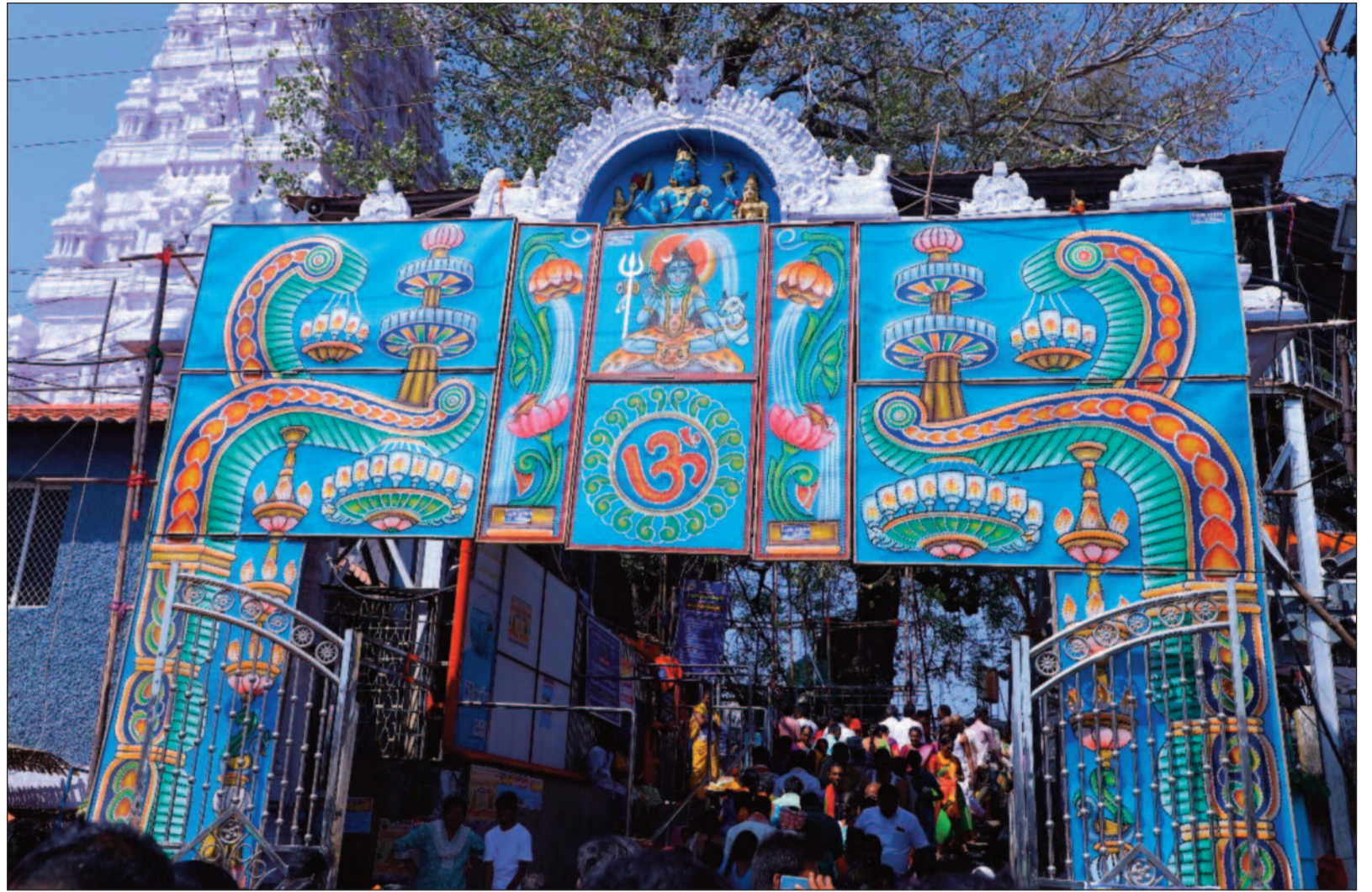
2.30 కోట్లతో ప్రత్యేక ఏర్పాట్లు నేటి నుండి జాతర ఉత్సవాలు