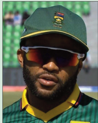
- టెంబా బుమా, దక్షిణాఫ్రికా కెప్టెన్

న్యూజిలాండ్ భారీ లక్ష్యం నమోదు చేసింది. మేం 10-20 పరుగులు అదనంగా ఇచ్చాం. వారు బ్యాటింగ్ చేసిన విధానం చూసి మేం సునాయనంగా 350 పరుగుల లక్ష్యాన్ని చేద్దామని భావించాము. మాకు ఒకటి, రెండు కీలక భాగస్వామ్యం కూడా వచ్చాయి. కానీ నేను లేదా రానీ వాన్ డెర్ డస్సెన్ ఎవరో ఒకరం భారీ ఇన్నింగ్స్ ఆడాల్సింది. కానీ అలా జరగలేదు. న్యూజిలాండ్ మమ్మల్ని ఒత్తిడిలోకి నెట్టి వికెట్లు సాధించింది. న్యూజిలాండ్ బ్యాటర్లు మిడిల్ ఓవర్లలో రాబట్టారు. చేతిలో వికెట్లు ఉండటంతో డెత్ ఓవర్లలో వారి బ్యాటర్లను కట్టడి చేయలేకపోయాం. ఈ గెలుపు క్రికెట్ న్యూజిలాండ్ బ్యాటర్లదే, రచివ్, విలియమ్స్ తో పాటు డారిల్ మిచెల్, గ్రేన్ ఫిలిప్స్ అద్భుతంగా ఆడారు. చేదనలో మేం 125/1తో మెరుగైన స్థితిలో నిలిచాం. క్రికెట్ నాతో పాటు రానీ సెట్ అయ్యి ఉన్నాడు. కానీ దురదృష్టవశాత్తు కీలక సమయంలో ఔట్.. మిడిలార్డర్ బ్యాటర్లపై ఒత్తిడిని పెంచాం. స్వచ్ఛంగా ఆడేందుకు కావాల్సిన వునానిని చేయలేకపోయాం. నాది సాఫ్ట్ డిస్ మిస్సల్ కానీ రానీ అద్భుతమైన బంతికి వెనుదిరిగాడు. దాంతో మా బ్యాటర్లపై ఒత్తిడి పెరిగింది. మేం ఇంకాస్త మెరుగ్గా ఆడి ఉండాలింది. కీలక సమయంలో ఔట్ ప్రత్యర్థికి అవకాశం కల్పించాం.