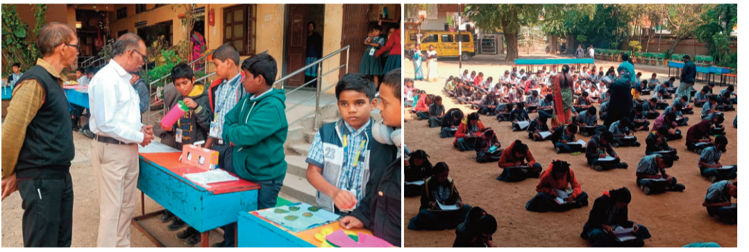
గర్వకారణమని పేర్కొన్నారు. విద్య అనేది కేవలం మార్కులకే పరిమితం కాదని, విద్యార్థుల్లో సృజనాత్మకత, ఆత్మవిశ్వాసం పెంపొందించడమే తమ లక్ష్యమని పేర్కొన్నారు. విద్యార్థులు శ్రీనివాస రామానుజన్ ను ఆదర్శంగా తీసుకొని గణిత శాస్త్రంలో నైపుణ్యాన్ని పెంపొందించుకొని శాస్త్ర, సాంకేతిక రంగాల్లో ఉన్నత శిఖరాలను అధిరోహించాలని ఆకాంక్షించారు. అనంతరం విద్యార్థులు గణితానికి సంబంధించిన నమూనాలు, ప్రదర్శనలు, లాజిక్ గేమ్స్, విద్యార్థులు పాల్గొన్నారు.