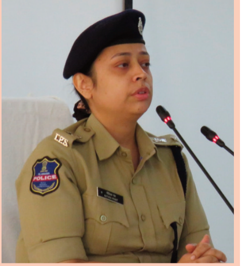
కలిపి సుమారు 33 లక్షల రూపాయలకుపైగా పరిహార నిధులు మంజూరయ్యాయని పేర్కొన్నారు. మహిళల

భద్రత కోసం ఏర్పాటు చేసిన 'భరోసా' కేంద్రం ద్వారా పోక్స్, అత్యాచార బాధితులకు కౌన్సెలింగ్ అందించడంతో పాటు, ఎఫ్బిఆర్ మరియు చార్జిషీట్ దశల్లోనే ప్రభుత్వ పరిహారం అందేలా చర్యలు తీసుకుంటున్నామని తెలిపారు.