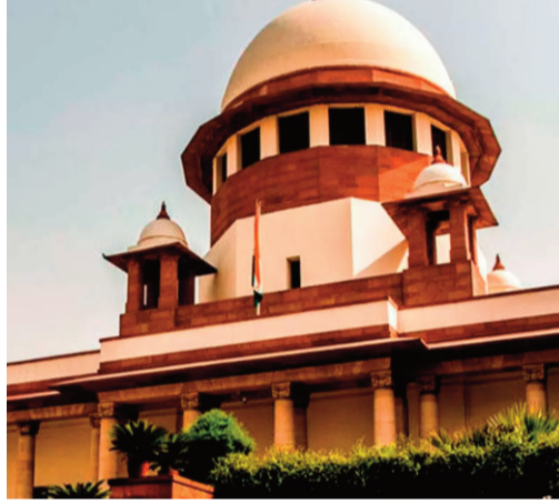
జారీ చేసింది. దీనిపై పూర్తి వివరాలతో అఫిడవిట్ దాఖలు చేయాలని కోరింది. పేదలకు విద్యుత్ కనీస అవసరాలు కల్పించడం ప్రభుత్వ బాధ్యత అని కోర్టు అంగీకరించింది. అయితే, పెద్ద పెద్ద భూస్వాములకు కూడా ఉచిత విద్యుత్ అందించడంపై అభ్యంతరం వ్యక్తం చేసింది. 'సౌకర్యం

న్యూఢిల్లీ: దేశంలో రాజకీయ పార్టీలు అందిస్తున్న ఉచిత పథకాలపై సుప్రీంకోర్టు మరోసారి తీవ్రస్థాయిలో స్పందించింది. తమిళనాడు విద్యుత్ పంపిణీ సంస్థకు సంబంధించిన కేసు విచారణ సందర్భంగా జస్టిస్ సూర్యకాంత్ ధర్మాసనం చేసిన వ్యాఖ్యలు ఇప్పుడు దేశవ్యాప్తంగా చర్చ నీయాంశమయ్యాయి. ఉచిత పథకాల వల్ల దేశ ఆర్థికాభివృద్ధి కంటుపడుతుందని కోర్టు హెచ్చరించింది. తమిళనాడులో ఉచిత విద్యుత్ సరఫరా, ఆర్థిక స్థితిగతులపై విచారణ చేపట్టిన కోర్టు, విద్యుత్ పంపిణీ సంస్థకు నిధులు ఎక్కడి నుండి వస్తున్నాయో వివరించాలని ప్రభుత్వానికి ఆదేశాలు