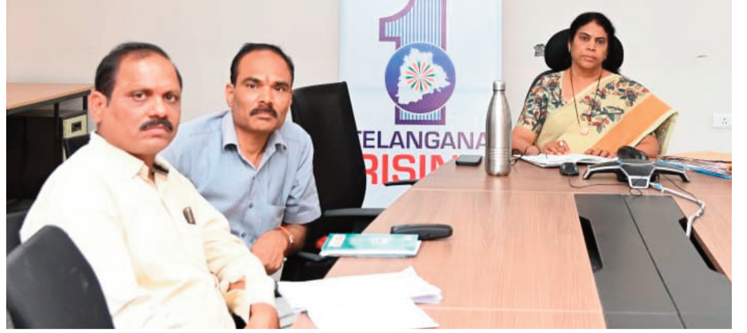
ప్రతి ఇంటింటికి నీరు అందించే కార్యక్రమంలో భాగంగా పైవుల్స్, ఓవర్ హెడ్ ట్యాంకులు, పేటి పంపులు, బోరు బావులను అందుబాటులోకి తీసుకురావాలని తెలిపారు. సంబంధిత అధికారులు ప్రజలకు సకాలంలో

ప్రజానావ, ఆసిఫాబాద్: వేసవిలో తాగునీటి ఎద్దడి లేకుండా చర్యలు తీసుకోవాలని జిల్లా కలెక్టర్ కె.హరిత అన్నారు. గురువారం సమీకృత కలెక్టరేట్ భవనంలోని తన చాంబర్లో వేసవిలో తాగునీటి సరఫరా పై మిషన్ భగీరథ, ఆర్డబ్ల్యుఎస్, ఇంజనీరింగ్ అధికారులతో సమీకృత సమావేశం నిర్వహించారు. ఈ సందర్భంగా జిల్లా కలెక్టర్ మాట్లాడుతూ వేసవిలో తాగునీటికి ఇబ్బందులు కలగకుండా ముందస్తు కార్యాచరణ రూపొందించుకోవాలని సూచించారు. సిర్కూర్ యు, లింగాపూర్, తిర్వాణి మండలాలలోని మారుమూల గిరిజన గ్రామాలకు నీటి సరఫరాను సక్రమంగా అందించేందుకు పైవుల్స్సు, పంప్ హౌస్ లకు మరమ్మత్తులు చేయాలి ఉంటే నెలరోగా పనులు పూర్తిచేసి వినియోగంలోకి తీసుకురావాలని ఆదేశించారు. కెరమెరి మండలంలోని ధనూ వద్ద డబ్బూపిటి పావుంట నిర్మాణ పనులను ఏప్రిల్ లోగా పూర్తి చేసి ప్రజలకు శుద్ధ జలాన్ని అందించాలన్నారు. గ్రామీణ నీటి సరఫరా శాఖ ఆధ్వర్యంలో