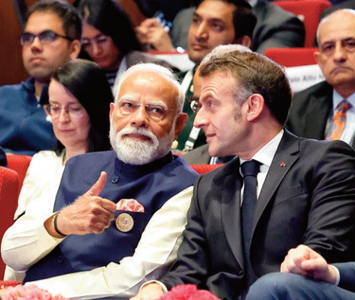
న్యూఢిల్లీ: ఆర్టిఫిషియల్ ఇంటెలిజెన్స్ (ఏఐ) సామర్థ్యం మన ఊహలకు అందనంత వేగంగా దూసుకుపోతోందని, అయితే ఈ సాంకేతికత మనషిని శాసించే స్థాయికి చేర కూడదని ప్రధానమంత్రి మోడీ సృష్టం చేశారు. దేశ రా