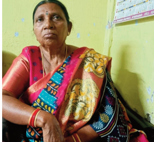
గుర్తు తెలియని దుండగుడు.. ఆమె వద్ద ఉన్న బ్యాగు నుంచి 16 తులాల బంగారు ఆభరణాలను దొంగిలించి

పరారయ్యాడు. ఈ భారీ చోరీ ఘటన స్థానికంగా కలకలం రేపింది. చోరీకి పాల్పడిన వ్యక్తిని గుర్తించేందుకు పోలీసులు ప్రత్యేక చర్యలు చేపట్టారు. బంగారం పోయిందని గుర్తించిన బాధితురాలు.. కన్నీరుమున్నీరుగా విలపిస్తూ జోగిపేట పోలీస్ స్టేషన్లో ఫిర్యాదు చేసింది. బాధితురాలి ఫిర్యాదు మేరకు పోలీసులు కేసు నమోదు చేసి దర్యాప్తు ప్రారంభించారు. బస్టాండ్ ఆవరణ, పరిసర ప్రాంతాల్లో ఉన్న సీసీ కెమెలాల ఫుటేజీని పరిశీలిస్తున్నారు. అనుమానిత వ్యక్తుల కదలికల ఆధారంగా నిందితుడిని పట్టుకునేందుకు గాలింపు చర్యలు చేపట్టారు. బస్టాండ్ లు, రద్దీ ప్రాంతాల్లో ప్రజలు అప్రమత్తంగా ఉండాలని పోలీసులు సూచించారు. ముఖ్యంగా విలువైన వస్తువులు తీసుకెళ్తున్నప్పుడు జాగ్రత్తగా ఉండాలని హెచ్చరించారు. అనుమానాస్పద వ్యక్తులు కనిపిస్తే వెంటనే పోలీసులకు సమాచారం ఇవ్వాలని సూచించారు. నిందితుడిని త్వరగా గుర్తించి బంగారాన్ని స్వాధీనం చేసుకుంటామని పోలీసులు తెలిపారు.