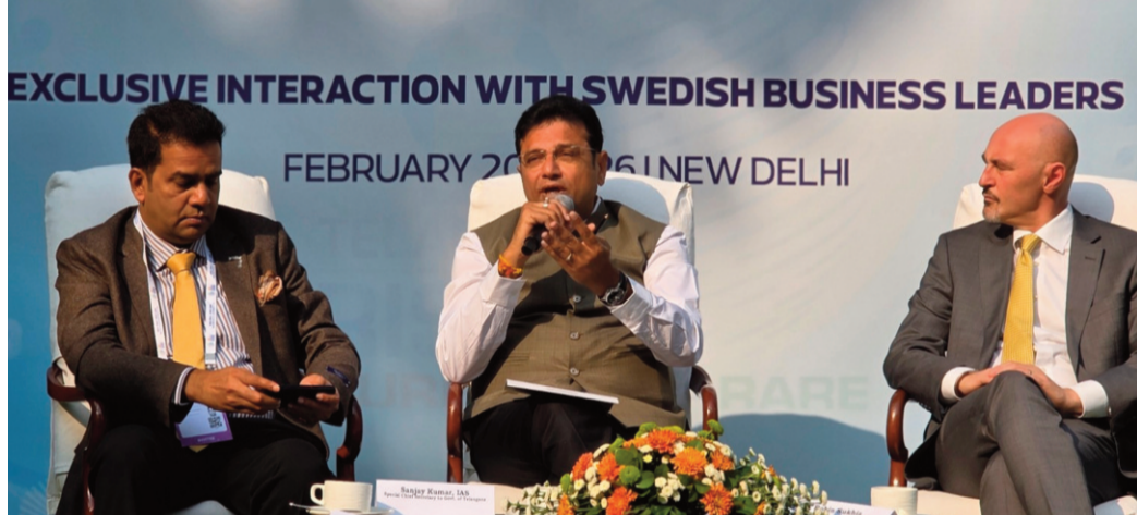
EXCLUSIVE INTERACTION WITH SWEDISH BUSINESS LEADERS FEBRUARY 20, 2025 NEW DELHI

నగరాల అభివృద్ధి, క్లీన్ ఎనర్జీ, డిజిటల్ మేనేజ్మెంట్ తదితర రంగాలకు విస్తరించేందుకు చర్యలు తీసుకుంటున్నా మన్నారు. తెలంగాణ అవకాశాల గని.. అపారమైన టాలెంట్ పూల్ మా బలం అని మంత్రి అన్నారు. తెలంగాణలో ఏటా పరిశోధన, అభివృద్ధిలకు ప్రభావశీలమైన టాలెంట్ పూల్ ఉందని తెలిపారు. ఏటా సమ్మిట్ లో స్వీడెన్ వాణిజ్య ప్రతినిధులను ఉద్దేశించి ప్రసంగించారు. కృత్రిమ మేధ వెలుగు వల్ల ఎదురయ్యే సవాళ్లను, అది తీసుకువచ్చే అవకాశాలను అందిపుచ్చుకునేందుకు సీఎం రేవంత్ రెడ్డి నాయకత్వంలోని మా ప్రభుత్వం ముందే సంసిద్ధమైంది. దానికి తగ్గట్టుగా సాఫ్ట్ వేర్ నిపుణుల నైపుణ్యాలు పెంచే కార్యక్రమాల ప్రారంభించాం. ఇదిలావుంటే ఏటా ఉద్యోగ విధుల్లో గణనీయమైన మార్పులు వస్తాయి. అందుకు అవసరమైన నన్నదను మొదలు పెట్టింది మా ప్రభుత్వమే. ఏటా పరిశోధన కేంద్రాలు, అప్లికేషన్లు, సేవల వల్ల కొత్త ఉద్యోగాలు పుట్టుకొస్తాయి. యువత దీనిని అందిపుచ్చుకోవాలి. యువత, వృత్తి నిపుణులు మంత్ర సృజనాత్మక బాధ్యతలు చేపట్టేందుకు ఏటా అపారమైన