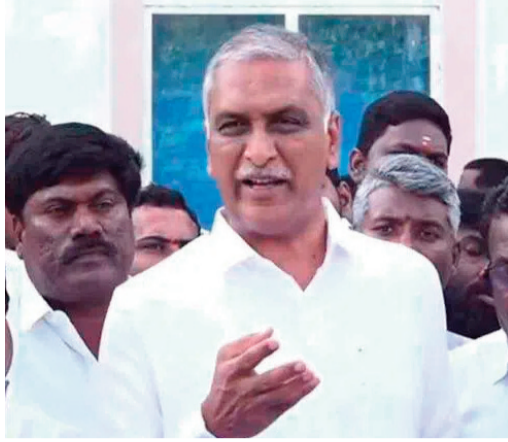
చేయడం లేదని దుయ్యబట్టారు. రైతు భరోసా నిధుల విడుదలపై ప్రభుత్వం చేస్తున్న తాత్కాలిక హాళీకేరావు తప్పుపట్టారు. మున్సిపల్ ఎన్నికల కోడ్ ముగియగానే

17వ తేదీన రైతు బంధు (రైతు భరోసా) ఇస్తామని చెప్పి, నేడు 20వ తేదీ వచ్చినా ఎందుకు నిధులు వేయలేదని సీఎం రేవంత్ రెడ్డిని నిలదీశారు. “రైతు బంధు ఎప్పుడు ఇస్తారు? నాల్గు వేసేటప్పుడా లేక కోతలు జరిగేటప్పుడా? బడా కాంట్రాక్టర్ల దగ్గర కమిషన్ కోసం రూ. 20 వేల కోట్ల బకాయిలు చెల్లించిన సర్కార్ కు, రైతులకు వేయడానికి డబ్బులు లేవా?” అని ఆయన నిలదీశారు. 2026 మార్చి కల్లా దేవారుల పూర్తి చేస్తామని చెప్పిన మంత్రులు ఇప్పుడు ఎక్కడికి పోయారని హాళీష్ రావు ప్రశ్నించారు. తాము అధికారంలో ఉన్నప్పుడు రూ. 7,300 కోట్లు ఖర్చు చేసి 80 శాతం పనులు పూర్తి చేశామని, మిగిలిన 2.40 లక్షల ఎకరాల ఆయకట్టు స్థిరీకరణకు కాంగ్రెస్ ప్రభుత్వం కనీసం రూ. 100 కోట్లు కూడా ఖర్చు చేయడం లేదని విమర్శించారు. రైతులను మోసం చేస్తున్న కాంగ్రెస్ ప్రభుత్వానికి తగిన గుణపాఠం తప్పదని హెచ్చరించారు.