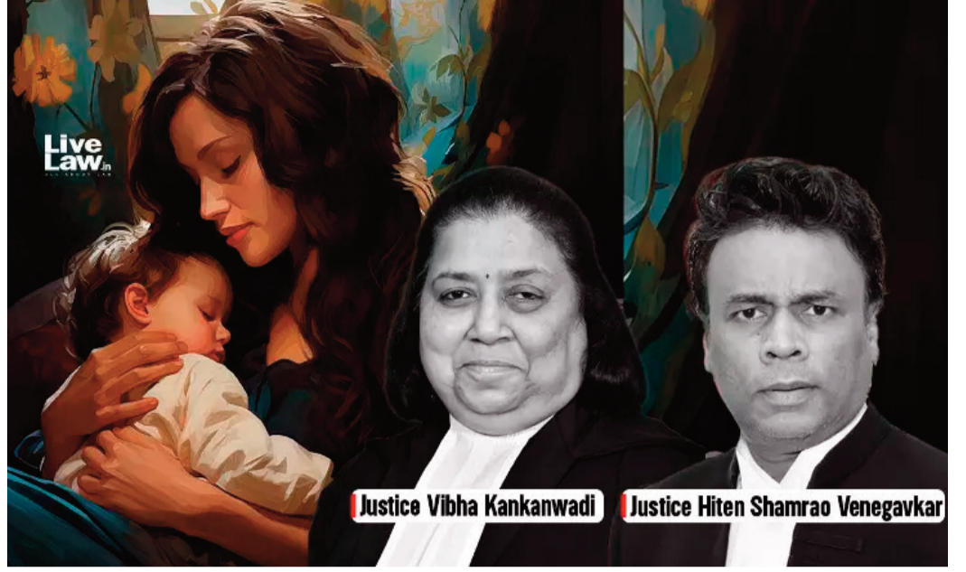
సరిదిద్దవచ్చని కోర్టు స్పష్టం చేసింది.