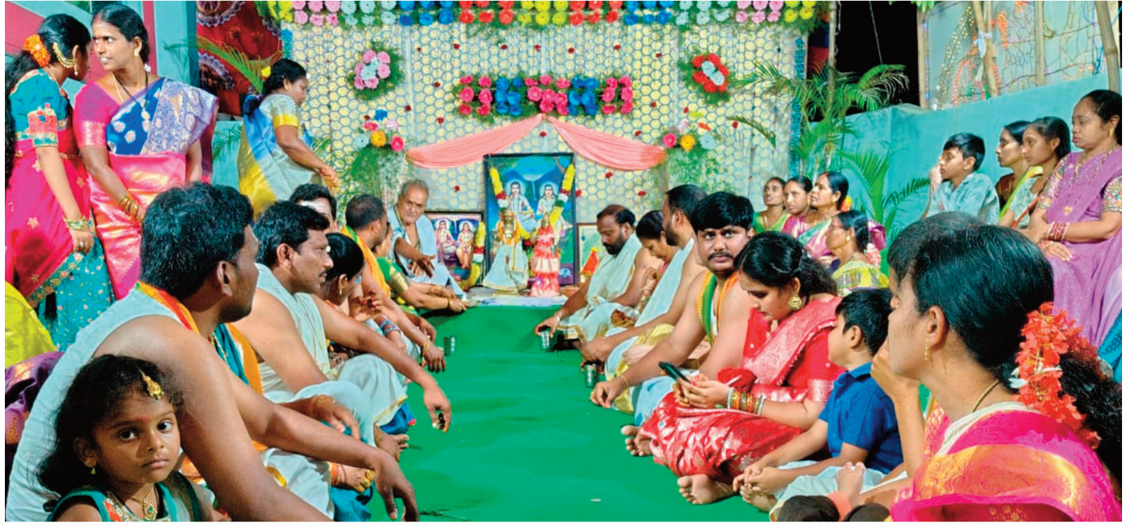
వేంసూర్ మండలం వెంకటాపురం గ్రామంలో పద్మశాలి సంఘం ఆధ్వర్యంలో శ్రీ భద్రావతి సమేత భావన ఋషి కల్యాణం శనివారం అంగరంగ వైభవంగా నిర్వహించారు. ఉదయం 7 గంటలకు ఆరంభం, ఉత్తవ మూర్తులను మేక తాళాలతో కళ్యాణ మహోత్సవ ప్రాంగణానికి తీసుకొచ్చారు. సాయంత్రం 4 గంటలకు వేలిం కార్యక్రమం నిర్వహించారు. రాత్రి 7 గంటలకు స్వామి వారి ఉత్తవ మూర్తులకు కళ్యాణం జరిపారు. అనంతరం గ్రామంలో భారీ ఊరేగింపుతో స్వామి వారు పురపీఠం గుండా ఊరేగింపు కార్యక్రమం చేపట్టారు. ఈ సందర్భంగా భక్తులకు మహా అన్నదాన కార్యక్రమం ఏర్పాటు చేశారు. ఈ కార్యక్రమంలో పద్మశాలి బంధువులు, వెంకటాపురం పద్మశాలి యాత్, తదితరులు పాల్గొన్నారు.