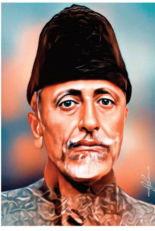
పత్రికా రంగం ద్వారా చైతన్యం:

తన 12వ ఏటనే 'నైరంగ్-ఎ-అలం' పత్రికను వెలువరించిన ఆజాద్, జాతీయోద్యమ దిశగా ప్రజలను ఉత్తేజితులను చేసేందుకు 'అల్ హిలాల్', 'అల్ బలాగ్' వంటి ఉర్దూ పత్రికలను నడిపారు. బ్రిటిష్ ప్రభుత్వం ఈ పత్రికలను చూసి కలవరపడి పలుమార్లు నిషేధించినప్పటికీ ఆయన తన పోరాటాన్ని ఆపలేదు. స్వాతంత్ర్య కాంక్షతో వదేళ్ల ఏడు నెలల పాటు దేశంలోని వివిధ జైళ్లలో కఠిన కారాగార శిక్షలను అనుభవించారు.