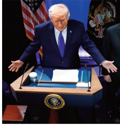
భారత్ పై వ్యాఖ్యలు

న్యూఢిల్లీ: అమెరికా సుప్రీంకోర్టు తన పూర్వ టారిఫ్ నిర్ణయాలను రద్దు చేసిన అనంతరం అధ్యక్షుడు డోలాన్ ట్రంప్ కొత్త నిర్ణయం ప్రకటించారు. ప్రపంచంలోని అన్ని దేశాలపై 10 శాతం గ్లోబల్ టారిఫ్ విధిస్తున్నట్లు వెల్లడించారు. ఈ మేరకు ఓవల్ ఆఫీస్ లో ఎగ్జిక్యూటివ్ ఆర్డర్ పై సంతకం చేసినట్లు తెలిపారు. వైట్ హౌస్ ప్రకటన ప్రకారం ఈ సుంకాలు ఫిబ్రవరి 24 నుంచి అమల్లోకి వచ్చి 150 రోజుల పాటు కొనసాగుతున్నాయి. సుప్రీంకోర్టు తన అధికారాలను పరిమితం చేస్తూ ఇచ్చిన తీర్పుపై తీవ్ర నిరాశ వ్యక్తం చేసిన ట్రంప్, “అవసరమైతే ప్రత్యామ్నాయ చట్టాల కింద మరింత కఠిన చర్యలు తీసుకుంటాం” అని హెచ్చరించారు. పాత చట్టం కింద విధించిన టారిఫ్లను కోర్టు కొట్టివేస్తే, ‘సెక్షన్ 122’ కింద 10 శాతం గ్లోబల్ సుంకం అమలు చేస్తామని స్పష్టం చేశారు. అవసరమైతే ఏ దేశంపైనైనా వాణిజ్య దిగ్బంధం విధించే అధికారం తనకు ఉందని పేర్కొన్నారు.