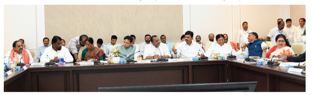
గ్రామాల్లో త్వరలోనే రీ-సర్వే చేపట్టబోతున్నామని, దీని కోసం బడ్జెట్లో తగిన నిధులు కేటాయించాలని కోరారు. భూ సమస్యల పరిష్కారంలో జాప్యాన్ని నివారించడానికి ప్రభుత్వం కీలక నిర్ణయం తీసుకుంది. రెవెన్యూ, స్టాంప్స్ అండ్ రిజిస్ట్రేషన్, సర్వే విభాగాలను