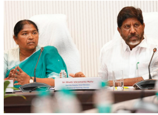
హార్ది స్థాయిలో విడుదల చేయించుకోవాలని అధికారులను ఆదేశించారు. గత ప్రభుత్వ నిర్ణయాల వల్ల పెండింగ్ లో

పంచాయతీరాజ్ వ్యవస్థ బలోపేతానికి ప్రభుత్వం కట్టుబడి ఉందని మంత్రి సీతక్క స్పష్టం చేశారు. కేంద్రం నుంచి రాష్ట్రానికి రావాల్సిన 15వ ఆర్థిక సంఘం నిధులను