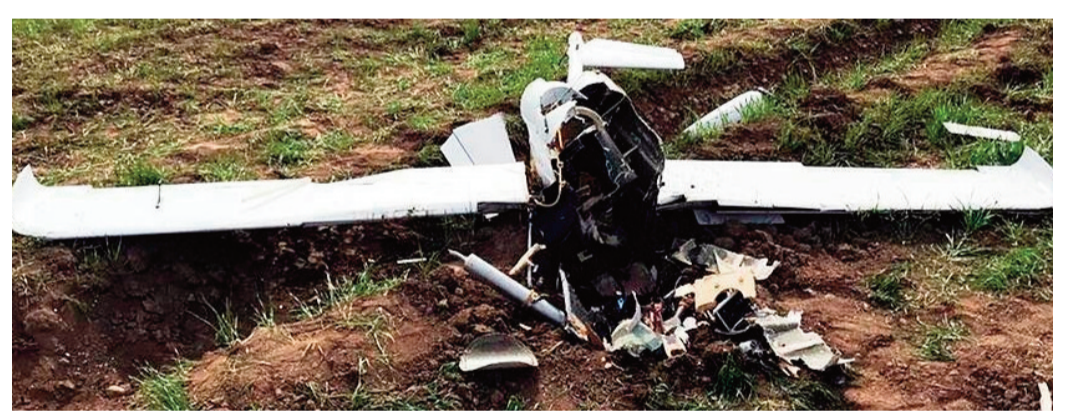
శాంతికి విఫలమైన కలిగిస్తున్నాయని ఆందోళన వ్యక్తం చేశారు.