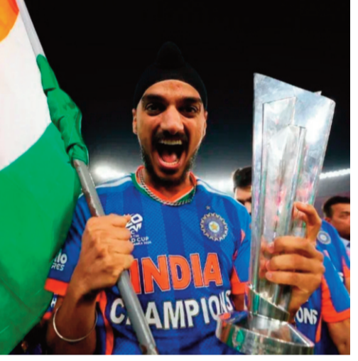
చేరింది. కేవలం పురుషుల జట్లో కాకుండా, గతేడాది మహిళల వన్డే ప్రపంచకప్ ను హర్మన్ ప్రీత్ సేన

గెలుచుకోవడం భారత్ క్రికెట్ లో నవకానికి నాంది పలికింది. నేడు దేశంలో క్రికెట్ కేవలం ఒక ఆట మాత్రమే కాదు, దాదాపు 100 కోట్ల మందిని ఏకం చేసే ఒక భావోద్వేగంగా మారింది.