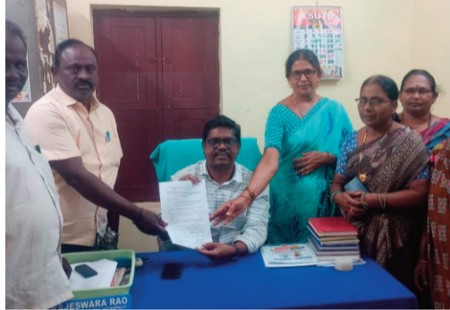
హైదరాబాద్ కార్యక్రమాన్ని విజయవంతం చేయాలని పిలుపునిచ్చారు. బుధవారం నత్తుపల్లి మండల విద్యా

ప్రజానావ, నత్తుపల్లి: మధ్యాహ్న భోజన కార్మికులకు రూ.10 వేల వేతనం అమలు చేయాలని ఏఐటీయూసీ తెలంగాణ రాష్ట్ర మధ్యాహ్న భోజన పథకం వర్కర్స్ యూనియన్ రాష్ట్ర మధ్యాహ్న భోజన పథకం వర్కర్స్ ప్రభుత్వాన్ని డిమాండ్ చేశారు. కాంగ్రెస్ పార్టీ ఎన్నికల మేనిఫెస్టోలో ఇచ్చిన హామీ ప్రకారం వేతన పెంపును వెంటనే అమలు చేయాలని కోరారు. ఈ సందర్భంగా ఈనెల 20న ప్రవేశపెట్టే రాష్ట్ర బడ్జెట్లో మధ్యాహ్న భోజన కార్మికుల వేతనాల కోసం నిధులు కేటాయించాలని అన్నారు. రాష్ట్ర వ్యాప్త పిలుపులో భాగంగా కార్మికుల సమస్యల సాధన కోసం ఈనెల 16న నిర్వహించే 'చలో