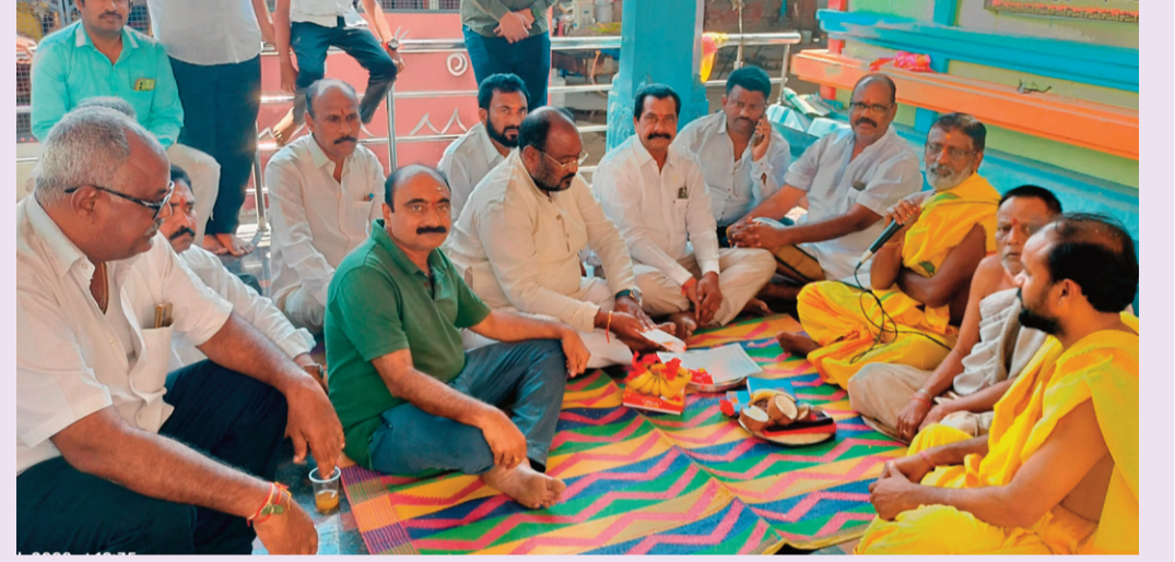
సీతారాముల కల్యాణానికి ఆహ్వానం