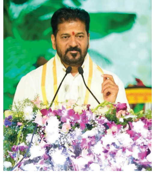
దేవస్థానం తరఫున నిర్వహించే తిరుకళ్యాణ బ్రహ్మాత్మవాలకు రాజాలని ఆహ్వానం పత్రానికను అందజేశారు.