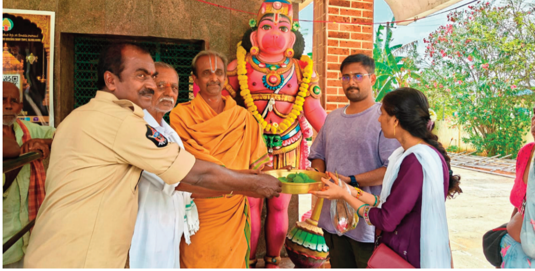
ప్రజానావ, చౌడేశ్వర్: సత్య ప్రమాణాలకు నిలయమైన రాజనాలబండపై శనివారం భక్తుల సందడి నెలకొంది. తెలుగు రాష్ట్రాల నుంచే కాకుండా ఇతర ప్రాంతాల నుండి భక్తులు పెద్ద సంఖ్యలో తరలివచ్చి స్వామివార్లను