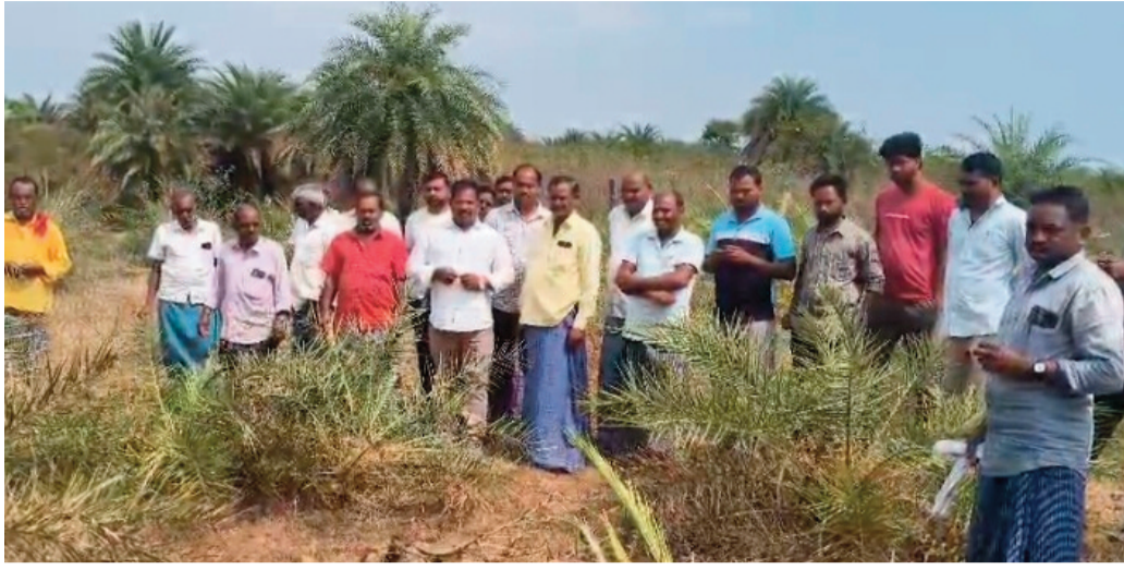
మాట్లాడుతూ.. గౌడ్ సమాజం ఐక్యంగా ఉండి తమ ప్రభుత్వం వెంటనే స్పందించి బాధితులకు న్యాయం చేయాలని కోరారు.

ప్రజానావ, కథలాపూర్: కథలాపూర్ మండలం బొమ్మెన గ్రామంలో గీతా కార్మికుల జీవనాధారమైన సుమారు 300 ఈత చెట్లను గుర్తుతెలియని వ్యక్తులు నరికివేయడం తీవ్ర ఉద్రిక్తతకు దారితీసింది. ఒకేసారి భారీ సంఖ్యలో చెట్లను ధ్వంసం చేయడంతో గౌడ్ కుటుంబాలు తమ ఉపాధిని కోల్పోయి రోడ్డున పడ్డాయి. గత ఏడాది కూడా ఇలాంటి ఘటన జరిగినప్పుడు పోలీసులు హెచ్చరించినప్పటికీ, ఈసారి మరింత తెగింపుతో చెట్లను నరికివేసారని బాధితులు ఆవేదన వ్యక్తం చేస్తున్నారు. తమ మంచితనాన్ని బలపీనతగా తీసుకుని కులవృత్తిపై దాడికి పాల్పడ్డారని గీతా కార్మికుల సంఘం ప్రతినిధులు మండిపడ్డారు. ఈ ఘటనపై పోలీసులకు ఫిర్యాదు చేసినట్లు తెలిపారు. ఎక్సైజ్ మరియు పోలీస్ శాఖలు స్పందించి, బాధ్యులపై సాన్-బెయిలబల్ కేసులు నమోదు చేసి కఠినంగా శిక్షించాలని డిమాండ్ చేశారు. ఈ సందర్భంగా నాయకుడు యాగండ్ల రమేష్ గౌడ్