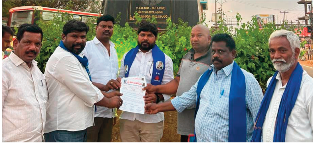
ప్రజానావ, వికారాబాద్: భారత్ రాజ్యాంగాన్ని 6వ తరగతి చేర్చాలనే డిమాండ్ తో జై భీమ్ మహాసేన చేపట్టిన సుండి పైచదువుల వరకు పాఠ్యపుస్తకాల్లో ప్రత్యేక సర్దుబాటుగా 'మహాభారత' శనివారం సాయంత్రం వికారాబాద్ జిల్లా