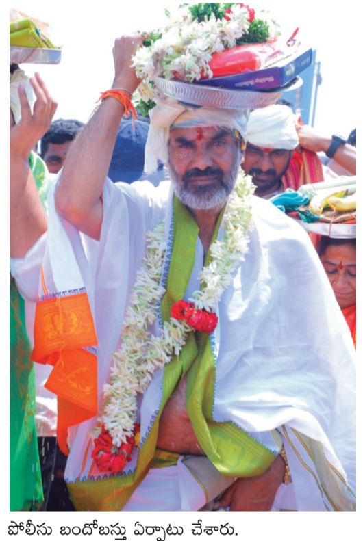
పోలీసు బందోబస్తు ఏర్పాటు చేశారు.