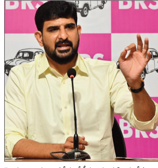
హెచ్చరించారు. ఒకవేళ నోటీసులను పట్టించుకోకుండా విచారణకు గైర్జరైతే చట్టపరమైన చర్యలు తప్పవని సీవెడీ అధికారులు హెచ్చరికలు జారీ చేశారు.

వచ్చే నెల 4వ తేదీ ఉదయం 11:30 గంటలకు విచారణకు రావాలని నోటీసుల్లో స్పష్టం చేశారు. వచ్చేటప్పుడు తన గుర్తింపు పత్రాలు.. ఈ కేసుకు సంబంధించిన ఇతర పత్రాలను వెంట తీసుకురావాలని సూచించారు. దర్యాప్తుకు పూర్తిగా సహకరించాలని.. సాక్ష్యాలను చెడగొట్టే ప్రయత్నం చేయవద్దని సాక్ష్యాలను చెడగొట్టే ప్రయత్నం చేయవద్దని