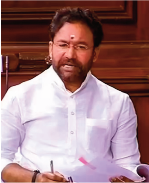
పనులకు వాడాలని.. అన్ టైడ్ గ్రాంట్ నిధులను స్థానిక అవసరాలకు అనుగుణంగా గ్రామసభల తీర్మానాల మేరకు ఖర్చు చేయవచ్చని సూచించారు. గత ప్రభుత్వాలు కేంద్ర నిధులను పక్కదారి పట్టించాయని, ప్రస్తుత ప్రభుత్వం అలా చేయకుండా పల్లెల అభివృద్ధికి సహకరించాలని కోరారు. రాజోయే ఐదేళ్లలో తెలంగాణ పంచాయతీలకు సుమారు రూ.9,968 కోట్ల గ్రాంట్లు అందనున్నాయని ఆయన వెల్లడించారు.

కేంద్రం నుంచి నిధులు అందిన వెంటనే రాష్ట్ర ప్రభుత్వం పది పనిదినాలలోపు ఆయా పంచాయతీలకు బదిలీ చేయాలని కిషన్ రెడ్డి స్పష్టం చేశారు. అలస్యమైతే వడ్డీతో కలిపి చెల్లించాల్సి ఉంటుందని హెచ్చరించారు. టైడ్ గ్రాంట్ నిధులను రోడ్డు, తాగునీరు, పారిశుధ్యం వంటి