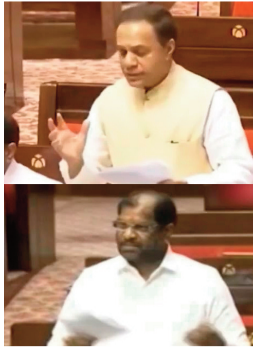
ఇప్పటికైనా విభజన చట్టం ప్రకారం హామీలు అమలు చేయాలని రాజ్యసభ సాక్షిగా ఎంపీలు డిమాండ్ చేశారు.

కాశేశ్వరం అంటే కేవలం ఒక డ్యాం కాదని.. అది కోట్ల మంది ఆశ అని ఎంపీ పేర్కొన్నారు. కేంద్ర మంత్రి సీఆర్ పాటిల్ లక్ష కోట్లు షోయాయని చేసిన వ్యాఖ్యలపై ఆగ్రహం వ్యక్తం చేస్తూ.. ఆయన తెలంగాణ ప్రజలకు క్షమాపణ చెప్పాలని డిమాండ్ చేశారు. ఆ వ్యాఖ్యలను వెంటనే రికార్డుల నుంచి తొలగించాలన్నారు. కాశేశ్వరంలో కూలిన రెండు పిల్లలను 300 కోట్లతో భాగు చేయవచ్చని తెలిపారు. గత 12 ఏళ్లుగా తెలంగాణకు కేంద్రం ఎలాంటి సహాయం చేయకపోయినా రాష్ట్రం అభివృద్ధి చెందుతోందని..