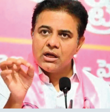
రాష్ట్ర ప్రభుత్వ సంస్థలను నిర్వీర్యం చేస్తూ ప్రైవేటు సంస్థలకు వత్సాను పలకడమేనా ప్రజా పాలన అంటూ బీఆర్ఎస్ వర్కింగ్ ప్రెసిడెంట్ కేటీఆర్ ప్రశ్నించారు. ఒక ప్రముఖ దినపత్రికలో వచ్చిన కథనాన్ని 'ఎక్స్' వేదికగా ట్యాగ్ చేస్తూ ఆయన ప్రభుత్వంపై విరుచుకుపడ్డారు.

రాష్ట్ర ప్రభుత్వ సంస్థలను నిర్వీర్యం చేస్తూ ప్రైవేటు సంస్థలకు వత్సాను పలకడమేనా ప్రజా పాలన అంటూ బీఆర్ఎస్ వర్కింగ్ ప్రెసిడెంట్ కేటీఆర్ ప్రశ్నించారు. ఒక ప్రముఖ దినపత్రికలో వచ్చిన కథనాన్ని 'ఎక్స్' వేదికగా ట్యాగ్ చేస్తూ ఆయన ప్రభుత్వంపై విరుచుకుపడ్డారు. రేవంత్ సర్కార్ రాష్ట్ర ప్రభుత్వ సంస్థ అయిన టెన్సోక్కు ఆర్డర్లు రద్దు చేసి ప్రైవేట్ కంపెనీలకు ఇచ్చి చేనేత సంఘాల కార్మికుల పొట్ట కొడుతుందని మండిపడ్డారు. ఇది ప్రజా ప్రభుత్వమే లేక ప్రైవేట్ లిమిటెడ్ కంపెనీయే అని ఆయన నిలదీశారు. విద్యాశాఖ ద్వారా టెన్సోక్కు రావాల్సిన రూ. 105 కోట్ల విలువ గల సూల్ యూనిఫామ్ ఆర్డర్లను వెనక్కి తీసుకోవడం వెనుక ఉన్న మతలబు ఏంటని కేటీఆర్ ప్రశ్నించారు. సంక్షేమ శాఖ నుండి టెన్సోక్కు దక్కాల్సిన రూ. 200 కోట్ల దుస్తులు, దుప్పట్ల ఆర్డర్లను ఇంకా ఇవ్వకపోవడం వెనుక కారణం ఏంటని అడిగారు. కాంగ్రెస్ ప్రభుత్వం కమిషన్లు దండుకోవాలనే యావలో ప్రైవేట్ వ్యక్తులకు ఆర్డర్లు ఇస్తోందని ధ్వజమెత్తారు. ప్రభుత్వాన్ని 'రండుపాళ్ళం ముఠా'తో పోల్చిన కేటీఆర్.. కమిషన్ల కోసం నేతన్నల జీవితాలతో అటలాడుకుంటున్నారని ఆగ్రహం వ్యక్తం చేశారు. నేతన్నల ఉసురు పోసుకుంటున్న ఈ కర్కశ కాంగ్రెస్ ప్రభుత్వానికి చరమగీతం పాడే రోజులు దగ్గరనే ఉన్నాయని ఆయన హెచ్చరించారు. ప్రభుత్వ సంస్థలను బలోపేతం చేయాల్సింది పోయి ప్రైవేట్ కర్కశలకు మేలు చేయడం సిగ్గుచేటని ఆయన విమర్శించారు.