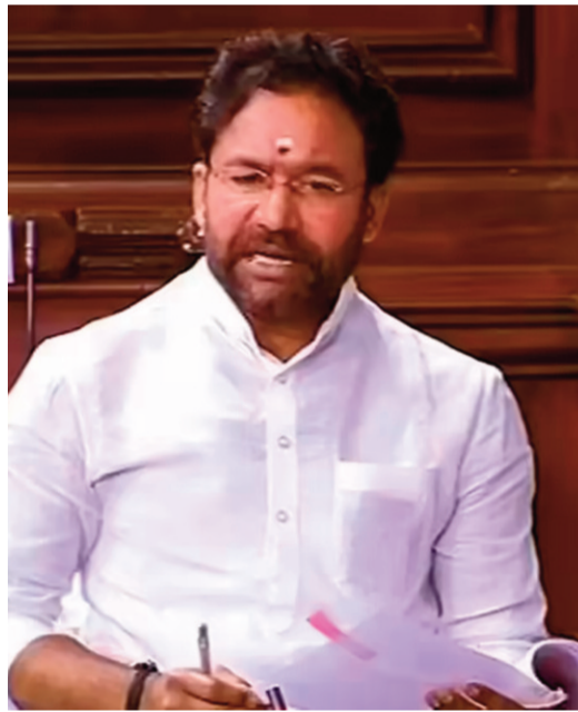
పనులకు వాడాలని.. అన్ టైడ్ గ్రాంట్ నిధులను స్థానిక అవసరాలకు అనుగుణంగా గ్రామసభల తీర్మానాల మేరకు ఖర్చు చేయవచ్చని సూచించారు. గత ప్రభుత్వాలు కేంద్ర నిధులను పక్కదారి పట్టించాయని, ప్రస్తుత ప్రభుత్వం అలా చేయకుండా పల్లెల అభివృద్ధికి సహకరించాలని కోరారు. రాజీయే ఐదేళ్లలో తెలంగాణ పంచాయతీలకు సుమారు రూ.9,968 కోట్ల గ్రాంట్లు అందనున్నాయని ఆయన వెల్లడించారు.

కేంద్రం నుంచి నిధులు అందిన వెంటనే రాష్ట్ర ప్రభుత్వం పది పనిదినాలలోపు ఆయా పంచాయతీలకు బదిలీ చేయాలని కిషన్ రెడ్డి స్పష్టం చేశారు. అలస్యమైతే వడ్డీతో కలిపి చెల్లించాల్సి ఉంటుందని హెచ్చరించారు. టైడ్ గ్రాంట్ నిధులను రోడ్డు, తాగునీరు, పారిశుధ్యం వంటి