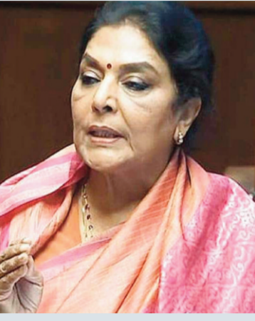
అమరావతి రాజధాని అంశాన్ని కేవలం రాజకీయంగా చూడకూడదని.. ఇది అమరావతి రైతుల గొప్ప విజయమని రేణుకా చౌదరి కొనియాడారు.