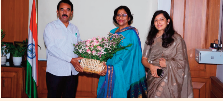
ప్రజానావ, హైదరాబాద్ :

మౌలిక వసతుల కల్పనపై ఫోకస్..నూతన ప్రాజెక్టులకు దిశానిర్దేశం