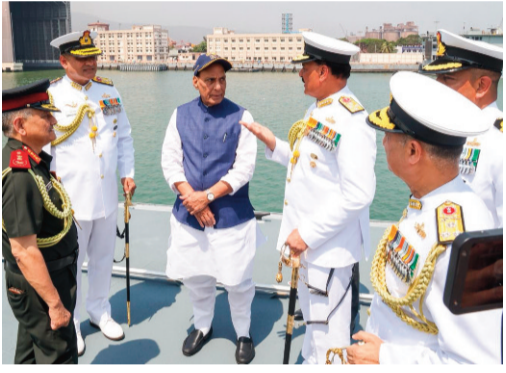
పనిచేసే సామర్థ్యం ఈ వార్షిక్ ప్రత్యేకత. ఐఎస్ఎస్ తారాగిరిని గతేడాది సవంబరు 28న నేవీకి అప్పగించారు.

పనిచేసే సామర్థ్యం ఈ వార్షిక్ ప్రత్యేకత. ఐఎస్ఎస్ తారాగిరిని గతేడాది సవంబరు 28న నేవీకి అప్పగించారు. 149 మీటర్ల పొడవు, 17.8 మీటర్ల వెడల్పుతో 6,670 టన్నుల బరువుండే ఐఎస్ఎస్ తారాగిరి కంబైన్డ్ డిజిల్/గ్యాస్ ఆధారిత ఫ్లాంటుతో సముద్ర జలాల్లో గంటకు 28 నాట్స్ చేగంత్ ప్రయాణించగలదు. ఇందులో నిశ్చల ఫిరంగులతో కూడిన అధునిక టెక్నాలజీ ఉంది. బరాక్-8 వంటి విమాన విధ్వంసక, 8 బ్రహ్మాన్ నౌకా విధ్వంసక క్షిపణులు ఇందులో ఉన్నాయి. యాంటీ సబ్మెరైన్ వార్ఫేర్ వ్యవస్థతోపాటు, శత్రువుల జాడను, ముప్పును ముందే పసిగట్టే రాదార్ వ్యవస్థ ఉంది. అరిదమన్ అనేది ఒక పదం కాదని.. ఒక శక్తి అని కేంద్ర రక్షణశాఖ మంత్రి రాజీనాథ్ సింగ్ అభివర్ణించారు. భారత్ మూడో స్వదేశీ అణు సబ్మెరైన్ అరిదమన్ అని తెలిపారు. దీంతో సముద్ర ఆధారిత అణు నిరోధకశక్తి మరింత