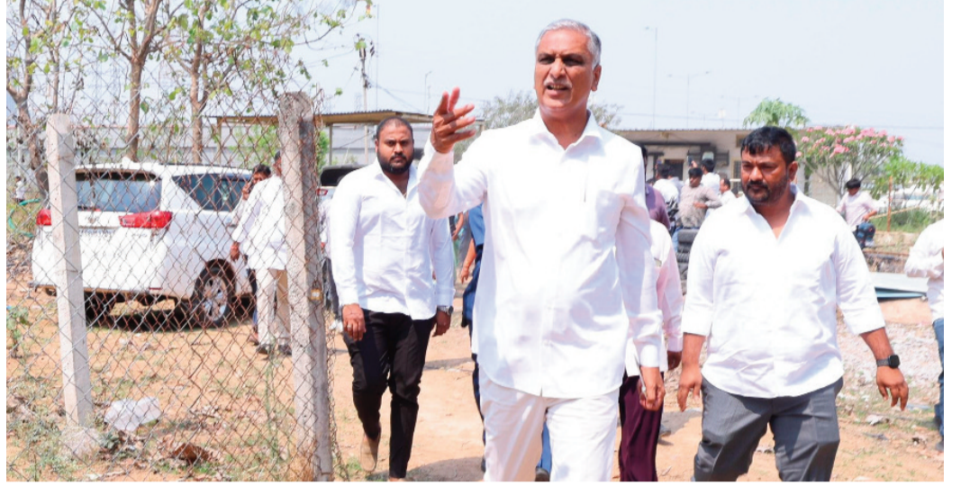
అరెస్ట్ చేశారు. రేవంత్ సర్కార్ తీరుపై ఆయన తీవ్ర ఆగ్రహం వ్యక్తం చేశారు.

ప్రజానావ, హైదరాబాద్: వంద రోజుల్లో ఆరు గ్యారంటీలు ఏమయ్యాయని ముఖ్యమంత్రి రేవంత్ రెడ్డిని మాజీ మంత్రి హాలిడ్ రావు ప్రశ్నించారు. తొమ్మిది వందల రోజులైనా హామీలు నెరవేరులేదని విమర్శించారు. వికారాబాద్ జిల్లా పరిగిలో భూములు కోల్పోతున్న రైతులను పలకరించేందుకు వెళ్తున్న హాలిడ్ రావును పోలీసులు అక్రమంగా