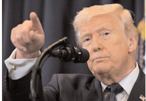
తెరవకపోతే ఆ దేశంలోని ఇరాన్ లో వంతెనలు, విద్యుత్ కేంద్రాలను లక్ష్యం చేసుకుంటామని సోమవారం ట్రంప్ హెచ్చరించిన విషయం తెలిసింది. అయినప్పటికీ అమెరికా ప్రతిపాదనలను ఇరాన్ తిరస్కరించడంతో.. ట్రంప్ తాజాగా మరోసారి హెచ్చరికలు చేశారు. ఇరాన్ లోని

వాషింగ్టన్: అమెరికా అధ్యక్షుడు ట్రంప్ మరోసారి ఇరాన్ కు తీవ్ర హెచ్చరికలు చేశారు. ఇరాన్ నాగరికత మొత్తం నేటి రాత్రితో అంతమైపోతుందని అన్నారు. దానిని మళ్ళీ ఎప్పుడీ పునరుద్ధరించలేదని 'ట్రూత్ సోషల్ వేదిక' పోస్టు పెట్టారు. ఇరాన్ లో 47 ఏళ్లుగా ఉన్న అవినీతి, అరాచక పాలన అంతం కానుందని.. ప్రపంచ చరిత్రలో ఈ రాత్రి ఓ మైలురాయిగా నిలిచిపోతుందని పేర్కొన్నారు. ఆ దేశాన్ని తుడిచిపెట్టడం నిజానికి తనకు ఇష్టం లేదని.. కానీ ఆ విధంగా చేయక తప్పట్లేదని పేర్కొన్నారు. అయితే ఇరాన్ లో కొత్త, తెలివైన నాయకత్వం వచ్చిందని, దాని పట్ల అదృశ్యాలు జరిగి అవకాశం కూడా ఉందన్నారు. మరొకటి గంటల్లో ఇరాన్ హరూజ్ ను