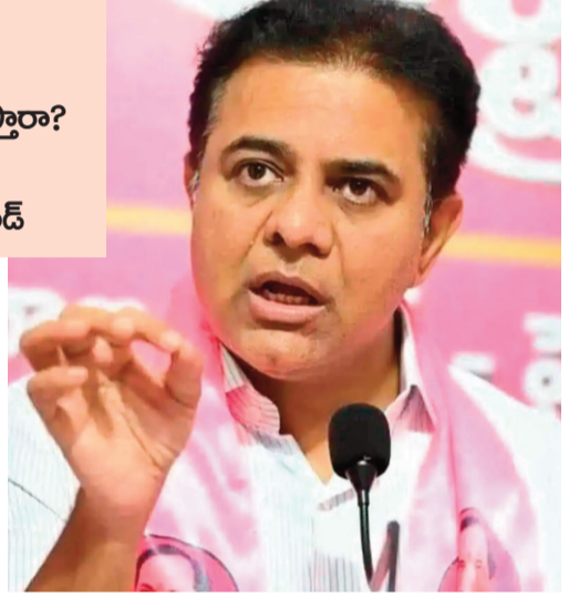
చేశారు. తమ భూమిని కాపాడుకోవాలని పోరాడుతున్న రైతులకు బాసటగా నిలిచేందుకు వెళ్తున్న నేతలను అక్రమంగా నిర్బంధించడం కాంగ్రెస్ ప్రభుత్వ పిరికిపంద చర్య అని అభివర్ణించారు. రైతు భరోసా, రుణమాఫీ, ఆరు గ్యారంటీలను అమలు చేయకుండా రైతులను ఇబ్బంది

ప్రజానావ, హైదరాబాద్: ప్రశ్నించే గొంతులను పోలీసు బలంతో నొక్కాలని చూడటం ప్రజాస్వామ్యాన్ని ఖాసీ చేయడమేనని బీఆర్ఎస్ వర్కింగ్ ప్రెసిడెంట్ కేటీఆర్ మండిపడ్డారు. పరిగి నియోజకవర్గంలోని కాల్వూర్, రాపాల్ గ్రామాల్లో ఇండస్ట్రీయల్ పార్క్ పేరుతో రైతుల నుంచి 1200 ఎకరాల భూమిని బలవంతంగా లాక్కోవడాన్ని తీవ్రంగా తప్పుపట్టారు. అధికారంలోకి వచ్చిన నాటి నుంచి రేవంత్ రెడ్డి ప్రభుత్వం ప్రజలకిచ్చిన హామీలను గాలికొదిలేసి, పేదల భూములపై పడిందని ఆగ్రహం వ్యక్తం చేశారు.