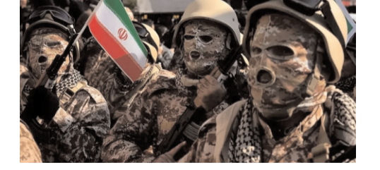
ప్రయత్నాలను, ప్రతికారం తీర్చుకుంటామని పునరుద్ఘాటించింది.

సంప్రదింపులు, చర్చల మార్గాల నుంచి ఇరాన్ వైదొలగింది. ఇరు దేశాల మధ్య సందేశాలు మార్పిడిని కూడా ముగించింది" ఎక్స్ (టీట్టర్) వేదికగా వెల్లడించింది. ఇరాన్ నాగరికత మొత్తం నేటి రాత్రితో అంతమైపోతుందన్న ట్రంప్ బెదిరింపులకు ఇరాన్ దీటుగానే కొంటర్ ఇచ్చింది. అమెరికా, దాని మిత్రులు కూడా తమ దెబ్బ ఎలా ఉంటుందో రుచి చూస్తాయని హెచ్చరించింది. ఈ క్రమంలోనే పాకిస్తాన్, టర్కీ, ఈజిప్టు మధ్యవర్తిత్వంతో అమెరికాతో సాగుతున్న చర్చలకు ఇరాన్ ముగింపు పలికింది. తమ 'రెడ్ లైన్స్' (హద్దులు) దాటితే పరిణామాలు తీవ్రంగా ఉంటాయని, తమ స్వయం పశ్చిమాసియా దాటి విస్తరిస్తుంది ఇరాన్ రెవల్యూషనరీ గార్డ్ కార్పొ వార్నింగ్ ఇచ్చింది. ఇప్పటికే గల్ఫ్ లోని అమెరికా సైనిక స్థావరాలు, ఇజ్రాయెల్ పై బాలిస్టిక్, క్రూయిజ్ క్షిపణులు, డ్రోన్లతో దాడులు చేసినట్లు రివల్యూషనరీ గార్డ్ కార్పొ ప్రకటించింది. సౌదీ అరేబియాలో అమెరికాకు చెందిన రెండు పెట్రోకెమికల్ కాంప్లెక్స్ లు, ఇజ్రాయెల్ సైనిక సామాగ్రి తరలివేసే నౌకపై కూడా కచ్చితమైన దాడులు చేశామని పేర్కొంది. పౌర లక్ష్యాలను తాము టార్గెట్ చేసుకోమని, కానీ తమ పౌర మౌలిక సదుపాయాలపై దాడులు చేస్తే మాత్రం వెనకడుగు వేసే