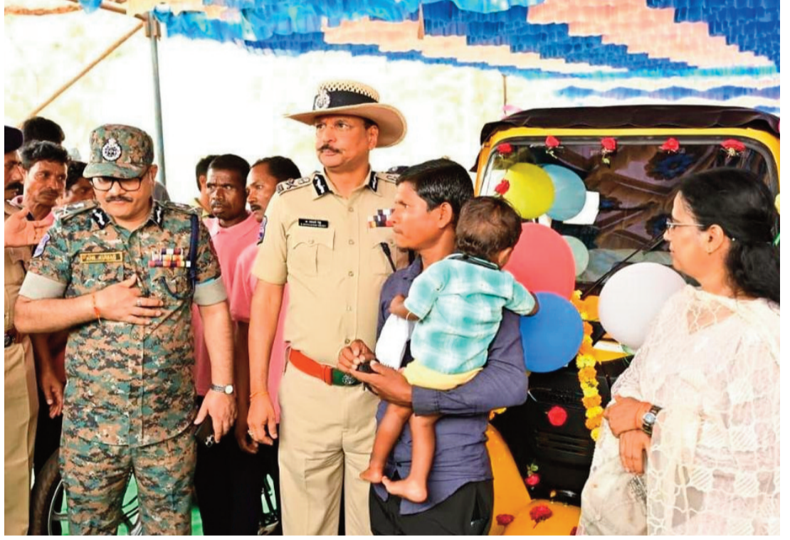
సౌకర్యం మెరుగుపడింది. అత్యవసర సమయాల్లో ఆసుపత్రికి వెళ్లడానికి గ్రామస్థుల కోసం ప్రభుత్వం ఒక ఆటో, టూ వీలర్స్ కు మ్యూనిసిటీ వాహనాలుగా అందజేసింది. గతంలో 12-13 కిలోమీటర్ల కాలినడకన వెళ్లాలిన దుస్థితి ఇప్పుడు తొలగిపోయింది. ఇప్పటికీ విద్యుత్ సౌకర్యం లేని మారుమూల ఇళ్లకు సోలార్ కండిక్షన్ పంపిణీ చేయడం ద్వారా ప్రభుత్వం చీకట్లను తొలగిస్తోంది. కనీసం ఆధారీ కార్డులు, ఓటు హక్కు వంటి కనీస గుర్తింపు కూడా లేని ఆదివాసీలకు ఇప్పుడు అన్ని ప్రభుత్వ ఫలాలను అందించడమే లక్ష్యంగా