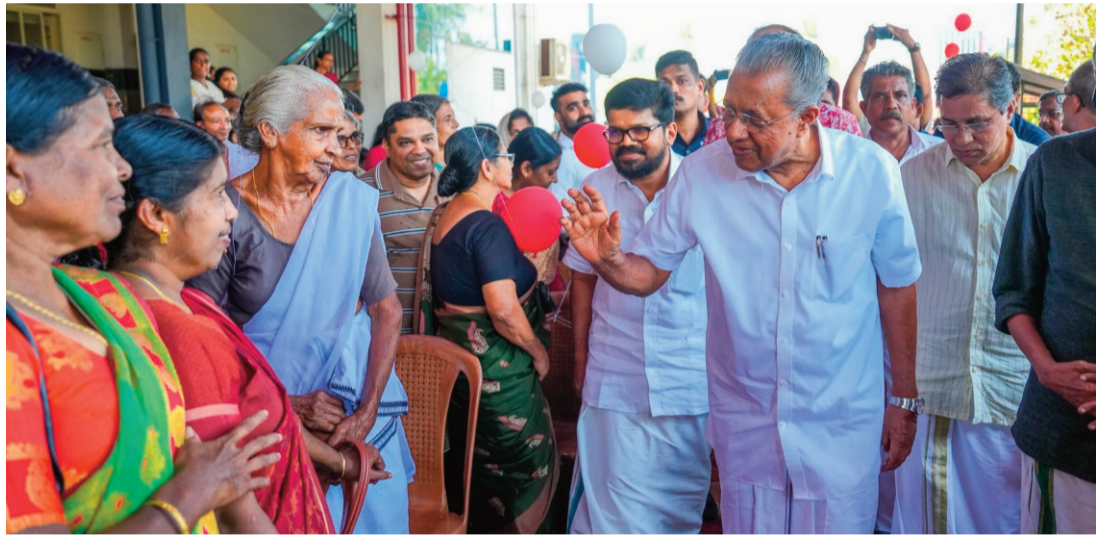
మీరు నా రాష్ట్రానికి వచ్చినప్పుడు, ఒక అతిథికి చేయాల్సిన అన్ని మర్యాదలు చేసానని మాట ఇస్తున్నా. ప్రస్తుత తెలంగాణ పరిస్థితికి మీరు నీతి ఆయోగ్ ఎన్నిజి ఇండెక్స్ 2023-24ని ప్రామాణికంగా చూపిస్తున్నారు. ఆ సూచీ డిసెంబర్ 2023లో ముగిసిన టీఆర్ఎస్ వదేళ్ల దుస్తునిపాలనను ప్రతిబింబిస్తుంది. మా ప్రభుత్వం 28 నెలలు పూర్తి చేసుకుంది. 2024-25లో తెలంగాణ జీపీపీ రూ.16.12 లక్షల కోట్లుగా ఉండి.. 10.7 శాతం వృద్ధిని నమోదు చేసింది. ఇది జాతీయ సగటు 9.9 శాతం కంటే ఎక్కువ. కర్ణాటక, తమిళనాడు, మహారాష్ట్ర, కేరళలను అధిగమించి భారత్ లోనే అత్యధిక తలసరి ఆదాయం ఉన్న రాష్ట్రంగా తెలంగాణ నిలిచింది. కేరళ ప్రజలకు మీ హయాంలో ఏం జరిగిందో చూపించండి' అని ఎక్స్ ప్రెస్ పూర్తి చేసుకుంది.

తిరువనంతపురం: తనతో చర్చకు రావాలన్న సీఎం రేవంత్ రెడ్డి సవాల్ పై కేరళం ముఖ్యమంత్రి పినరయి విజయన్ తిప్పికొట్టారు. ఆయనతో చర్చకు దిగి ఉద్దేశం తనకు లేదన్నారు. రేవంత్తో చర్చకు దిగేందుకు తెలంగాణలో పార్టీలు ఉన్నాయని, ఆయన ప్రభుత్వ పనితీరుపై అక్కడి ప్రజలే తీర్పునిచ్చాలని వ్యాఖ్యానించారు. తమ పార్టీ నేతలు అక్కడ రేవంత్ వ్యవహారంపై మాట్లాడుతారని అన్నారు. నీతి ఆయోగ్ 2023-24 సుస్థిరాభివృద్ధి లక్ష్యాల సూచీలో కేరళ తొలి స్థానంలో ఉందని పినరయి విజయన్ అంటున్నారని, ఇది కేరళలో ఏడు దశాబ్దాల ప్రభుత్వాలన్నింటి కృషి అని సోమవారం సీఎం రేవంత్ పేర్కొన్న సంగతి తెలిసింది. అందులో కాంగ్రెస్ నేతృత్వంలోని యూడిఎఫ్ కూడా ఉందని గుర్తించాలన్నారు. అందరి కష్టాన్ని సొంత ఖాతాలో వేసుకోవడం సరికాదని హితవు పలికారు. ఈ అంశంపై చర్చించేందుకు సిద్ధంగా ఉన్నారని, చర్చకు రావాలని పినరయి విజయన్ కు సవాల్ విసిరారు. తెలంగాణ ప్రభుత్వ పనితీరును విమర్శిస్తూ కేరళ సీఎం పినరయి విజయన్ రాసిన లేఖపై సీఎం రేవంత్ రెడ్డి మరోసారి స్పందించారు. కేరళ ప్రభుత్వ పనితీరుపై తన విమర్శలను ఎంతో గౌరవప్రదంగా, హుందాగా వ్యక్తం చేశానని అన్నారు. విజయన్ మాత్రం తప్పుపై స్థాయి భాషను ఉపయోగించాలని నిర్ణయించుకున్నట్లు చెప్పారు. 'మీ అసహనపూరిత వ్యాఖ్యలకు నేను అదే రీతిలో స్పందించను.'