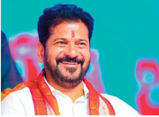
ప్రభుత్వం అంటే తనకు నచ్చడన్నారు. ఊమెన్ చాండీ కరుణాకర్ ఆధ్వర్యంలో కేరళ అభివృద్ధి చెందిందన్నారు.

మధ్య ఒప్పందం ఉంది. కేసుల నుంచి మోదీ ఆయనను రక్షిస్తున్నారు. రాష్ట్రంలో యువతను విజయన్ మోసం చేస్తున్నారు. కేరళ ప్రజల నుంచి నాకు ఫీడ్ బ్యాక్ వచ్చింది. విజయన్ కు కేసీఆర్ మంచి మిత్రుడు. కేసీఆర్ పాలన గురించి విజయన్ ప్రస్తావించారని రేవంత్ అన్నారు. కేరళ యువత హార్ట్ వర్కింగ్ పీపుల్ అని సీఎం రేవంత్ రెడ్డి కొనియాడారు. తాజాగా కేరళం ఎన్నికల ప్రచారంలో పాల్గొన్న సీఎం రేవంత్ అక్కడి ప్రభుత్వంపై విమర్శలు గుప్పించారు. గల్ఫ్ దేశాల అభివృద్ధిలో కేరళం యువత పాత్ర కీలకమన్నారు. కేరళంలోనే విషాద స్థానికం యునైటెడ్ డెమోక్రటిక్ ఫ్రంట్ ప్రభుత్వం చరమాంకం పలుకుతున్నారని. యూడిఎఫ్ గవర్నమెంట్ పన్నులని ధీమా వ్యక్తం చేశారు. పినరయి విజయన్ అంటే తనకు గౌరవమని.. కానీ ఆయన