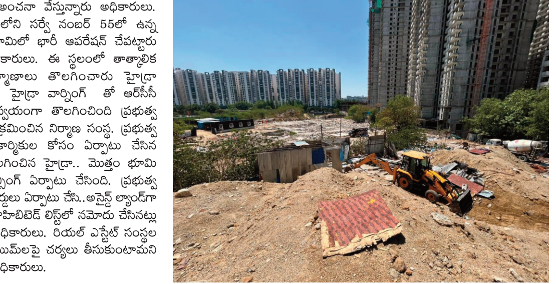
ంటుందని అంచనా వేస్తున్నారు అధికారులు. ఖానామెట్ లోని సర్వే సంఖ్య 55లో ఉన్న ప్రభుత్వ భూమిలో భారీ ఆపరేషన్ చేపట్టారు హైద్రా అధికారులు. ఈ స్థలంలో తాత్కాలిక షెడ్యూ, నిర్మాణాలు తొలగించారు హైద్రా అధికారులు. హైద్రా వార్షిక్ తో ఆర్ఎస్సీ ఫ్లాంట్ ను స్వయంగా తొలగించింది ప్రభుత్వ భూమిని అక్రమించిన నిర్మాణ సంస్థ. ప్రభుత్వ భూమిలో కార్మికుల కోసం ఏర్పాటు చేసిన షెడ్యూ తొలగించిన హైద్రా.. మొత్తం భూమి చుట్టూ ఫెన్సింగ్ ఏర్పాటు చేసింది. ప్రభుత్వ భూమిగా బోర్డులు ఏర్పాటు చేసి, అసైన్డ్ ల్యాండ్ గుర్తించి, ప్రాహిటిబిడ్ లిస్ట్ లో నమోదు చేసినట్లు తెలిపారు అధికారులు. రియల్ ఎస్టేట్ సంస్థల తప్పుడు క్లెయిమ్లపై చర్యలు తీసుకుంటామని తెలిపారు అధికారులు.

ప్రజానావ, హైదరాబాద్: బట్టీ కారిడార్ లో హైద్రా భారీ ఆపరేషన్ నిర్వహించింది. మంగళవారం ఖానామెట్ లో రూ. 12 వందల కోట్ల విలువైన ప్రభుత్వ భూమిని కట్టా చెర సుంచి కాపాడింది. ఇందుకు సంబంధించి వివరాలిలా ఉన్నాయి. బట్టీ కారిడార్ కు చేరువలోని ఖానామెట్ లో 8 ఎకరాలకు పైగా ప్రభుత్వ భూమిలో అక్రమణలు తొలగించింది హైద్రా. స్థానికుల ఫిర్యాదు మేరకు రంగంలోకి దిగిన హైద్రా అధికారులు అక్రమణల కూల్చివేత చేపట్టారు. హైద్రా కాపాడిన ప్రభుత్వ భూమి విలువ సుమారు రూ. 12 వందల కోట్లు ఉ