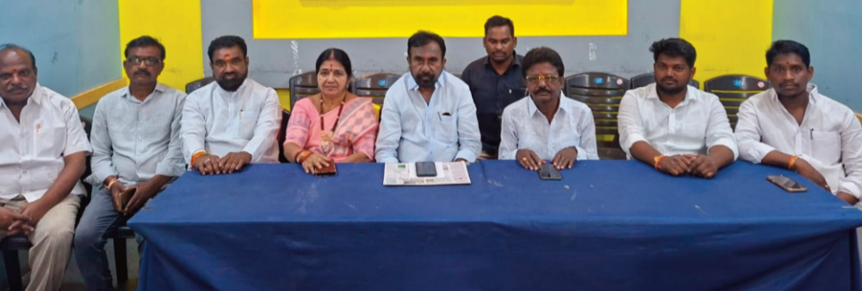
చొరవతో సబ్ స్టేషన్ ఏర్పాటులో సఫలీకృతం అయిందన్నారు. సుఖాష్ నగర్, సిరిసిల్ల బైపాస్ రోడ్డు, పాపయ్య పల్లె, మద్దిమల్ల మొదలైన గ్రామాలలో విద్యుత్ సబ్ స్టేషన్లు మంజూరైనట్లు తెలిపారు. సబ్ స్టేషన్ల ఏర్పాటుతో రైతుల్లో సంతోషం వ్యక్తం అవుతుందన్నారు. ప్రస్తుత గడ్డు కాలంలో ఈ సబ్ స్టేషన్లు రైతులకు చాలా ఉపయోగకరంగా ఉంటాయన్నారు. వీటి ఏర్పాటుకు సహకరించిన ముఖ్యమంత్రి రేవంత్ రెడ్డి, ఉప ముఖ్యమంత్రి బిడ్డి విక్రమార్యు ఎన్టీడీసీఎల్ అధికారులకు ప్రకాష్ కృతజ్ఞతలు తెలిపారు.

ప్రజానావ, సిరిసిల్ల : రైతుల లోపేజీల్లో, విద్యుత్ సమస్యల పరిష్కారం కోసం సిరిసిల్ల నియోజకవర్గంలో ఆరు 33/11 కేవీ సబ్ స్టేషన్లు మంజూరు కావడం పట్ల రైతులు ఆనందోత్సవాలతో ఉన్నారని సిరిసిల్ల పట్టణ కాంగ్రెస్ అధ్యక్షులు చొప్పుదండి ప్రకాష్ వెల్లడించారు. గురువారం సిరిసిల్ల ప్రెస్ క్లబ్ లో కాంగ్రెస్ నాయకులు, కౌన్సిలర్లతో కలిసి చొప్పుదండి ప్రకాష్ మీడియా సమావేశం నిర్వహించారు. ప్రభుత్వ విప్ ఆది శ్రీనివాస్, కాంగ్రెస్ పార్టీ సిరిసిల్ల నియోజకవర్గ ఇన్చార్జ్ కేకే మహేందర్ రెడ్డి