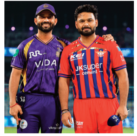
కోల్కతా బ్యాటింగ్ తీరు

కోల్కతా: ఐపీఎల్ టోర్నీలో భాగంగా గురువారం ఈడెన్ గార్డెన్స్ వేదికగా కోల్కతా నైట్ రైడర్స్, లక్కో సూపర్ జెయింట్స్ మధ్య జరిగిన మ్యాచ్ అభిమానులను మునివేళ్లపై నిలబెట్టింది. ఆఖరి బంతి వరకు ఉత్పరధరితంగా సాగిన ఈ పోరులో లక్కో జట్టు 3 వికెట్ల తేడాతో అద్భుత విజయాన్ని సమోదా చేసింది. టాప్ గెలిచిన లక్కో కెప్టెన్ ముందుగా బొలింగ్ ఎంచుకున్నాడు. తొలుత బ్యాటింగ్ చేసిన కోల్కతా నిర్ణీత 20 ఓవర్లలో 4 వికెట్ల నష్టానికి 181 పరుగులు చేసింది. లక్కో ఛేదనలో లక్కో జట్టు 7 వికెట్లు కోల్పోయి ఆఖరి బంతికి విజయాన్ని అందుకుంది.