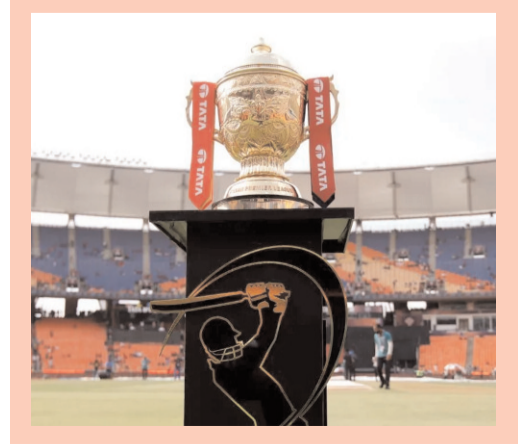
ఇదే ఐపీఎల్ ప్రత్యేకత అని చెప్పాలి.