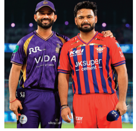
కోల్ కతా బ్యాటింగ్ తీరు

కోల్ కతా: ఐపీఎల్ టోర్నీలో భాగంగా గురువారం ఈడెన్ గార్డెన్స్ వేదికగా కోల్ కతా నైట్ రైడర్స్, లక్కో సూపర్ జెయింట్స్ మధ్య జరిగిన మ్యాచ్ అభిమానులను మునివేళ్లపై నిలబెట్టింది. ఆఖరి బంతి వరకు ఉత్పరధరితంగా సాగిన ఈ పోరులో లక్కో జట్టు 3 వికెట్ల తేడాతో అద్భుత విజయాన్ని సమోదా చేసింది. టాప్ గెలిచిన లక్కో కెప్టెన్ ముందుగా బొలింగ్ ఎంచుకున్నాడు. తొలుత బ్యాటింగ్ చేసిన కోల్ కతా నిర్ణీత 20 ఓవర్లలో 4 వికెట్ల నష్టానికి 181 పరుగులు చేసింది. లక్కో ఛేదనలో లక్కో జట్టు 7 వికెట్లు కోల్పోయి ఆఖరి బంతికి విజయాన్ని అందుకుంది.