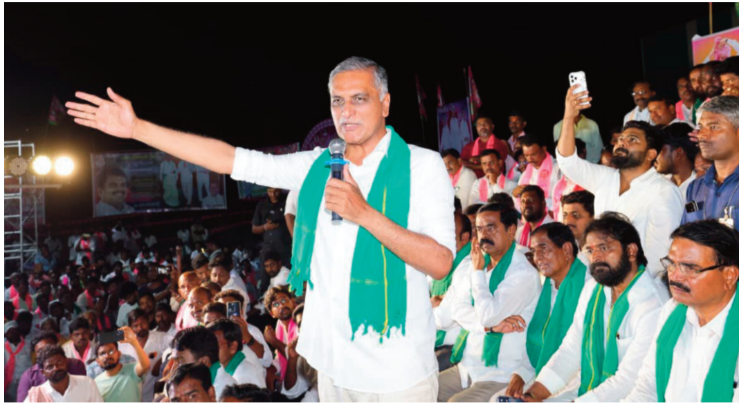
బయటపెట్టారని హాదీస్ రావు గుర్తు చేశారు. అనుమతులు లేకుండా కంపెనీ నడుపుతున్నారని అధికారులు నోటీసులు కూడా ఇచ్చారని ప్రస్తావించారు.

మరి అధికారులు, సీఎం చెప్పింది తప్ప.. లేక పొంగులేటి చెప్పింది తప్ప అని ప్రశ్నించారు. ఈ విషయాన్ని తాము లేవనెత్తిన తర్వాతే రాఫువ కన్స్ట్రక్షన్స్ చెందిన కంట్రెనర్ పై రంగు పేసి కాంగ్రెస్ జెండా తీసేశారని ఆరోపించారు. మంత్రులు జూపల్లి కృష్ణారావు, మల్లు భట్టి విక్రమార్కు సీఎం నోడరుల అవినీతి బాగాతాన్ని పొంగులేటినే బయటపెట్టారని ఎద్దేవా చేశారు.