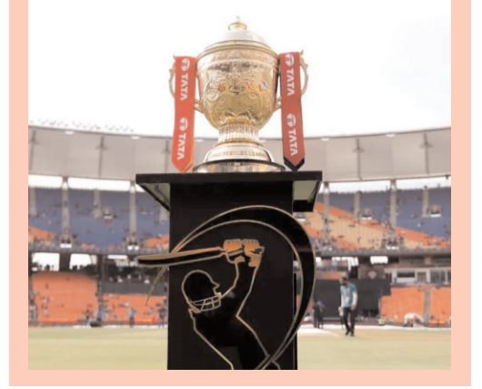
ఇదే ఐపీఎల్ ప్రత్యేకత అని చెప్పాలి.