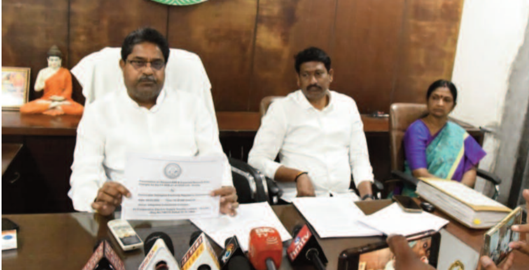
భూవిస్తున్నట్లు చైర్మన్ వెల్లడించారు. ఏడాదికాలంగా కుట్రలు జరుగుతున్నాయని, ప్రభుత్వ పెద్దలు పరోక్షంగా హెచ్చరికలు కూడా చేశారన్నారు.