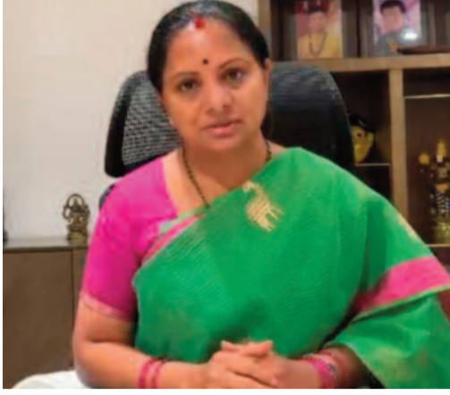
ఈ రెండు బిల్లులను కలిపి పార్లమెంటు ముందుకు తీసుకువచ్చినందుకు ఆమె ఆరోపించారు. గతంలో కొత్త పార్లమెంట్ భవనం ప్రారంభోత్సవం సమయంలోనే మహిళా రిజర్వేషన్ బిల్లును ప్రవేశపెట్టి ఆమోదించిన

ప్రజానావ, హైదరాబాద్: చట్టసభల్లో మహిళా రిజర్వేషన్ బిల్లుపై బీజేపీకి చిత్తశుద్ధి లేదని మరోసారి నిరూపితం అయ్యిందని తెలంగాణ జాగృతి అధ్యక్షురాలు కల్వకుంట్ల కవిత విమర్శించారు. లోక్ సభలో మహిళా బిల్లు వీగిపోవడంపై ఆమె స్పందిస్తూ, బీజేపీ కుట్రపూరిత వైఖరి వల్లే ఈ పరిస్థితి తలెత్తినదని ధ్వజమెత్తారు. డీమిటేషన్ (నియోజకవర్గాల పునర్విభజన) బిల్లుతో మహిళా బిల్లును ముడిపెట్టడం వల్లే ప్రతిపక్షాలన్నీ ఏకమై లోక్ సభలో బిల్లు వీగిపోయేలా చేశారని ఆమె అభిప్రాయపడ్డారు. రాజకీయ లబ్ధి పొందాలనే ఉద్దేశంతోనే కేంద్ర ప్రభుత్వం