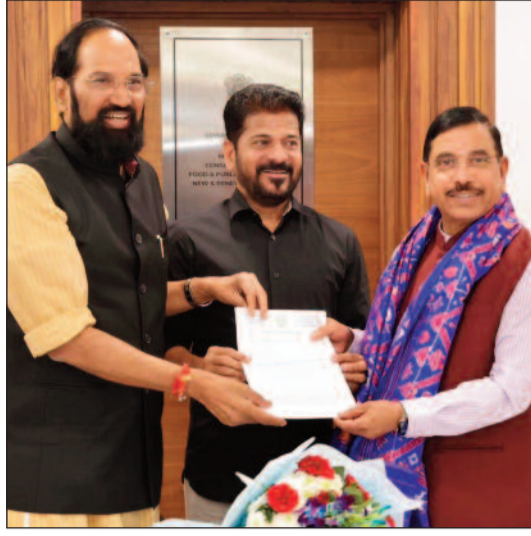
రైతుల నుంచి కొనుగోలు చేయబోతున్నాం. వరి ధాన్యం

న్యూఢిల్లీ, ఏప్రిల్ 17: 2025-26 వానాకాలం, యాసంగి సీజన్లకు సంబంధించి 30 లక్షల మెట్రిక్ టన్నుల పార్ బాయిల్ ధాన్యం సేకరించాలని కేంద్రమంత్రికి సీఎం రేవంత్, మంతరి ఉత్తమ్ విజ్ఞప్తి చేశారు. అలాగే యాసంగి పంట 90 లక్షల మెట్రిక్ టన్నులు పన్నుదని కేంద్రమంత్రి ప్రహ్లాద్ జోషికి సీఎం రేవంత్ వివరించారు. ఈ ధాన్యం మొత్తం కొనుగోలు చేసి తెలంగాణ రైతాంగానికి అండగా నిలవాలని కోరారు. కేంద్ర పౌరసరఫరాల శాఖ మంత్రి ప్రహ్లాద్ జోషితో తెలంగాణ సీఎం రేవంత్ రెడ్డి, మంత్రి ఉత్తమ్ కుమార్ రెడ్డి భేటీ అయ్యారు. కేంద్ర పౌరసరఫరాల శాఖ నుంచి రాష్ట్రానికి రావాల్సిన పెండింగ్ నిధులు, ఇతర అంశాలపై చర్చించారు. కేంద్ర మంత్రి భేటీ అనంతరం మంత్రి ఉత్తమ్ కుమార్ రెడ్డి మాట్లాడుతూ.. 'దేశంలోనే అత్యధికంగా తెలంగాణలో వరిధాన్యం ఉత్పత్తి జరుగుతోంది. ఈ రబీ సీజన్లో 90 లక్షల మెట్రిక్ టన్నుల వరి ధాన్యం