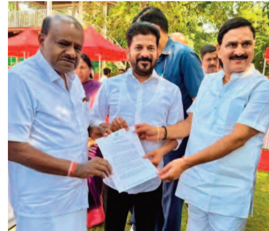
గాంధీ బయటపెట్టారని ముఖ్యమంత్రి అన్నారు. తెలంగాణ ప్రజల తరఫున రాహుల్ గాంధీ, మల్లికార్జున ఖర్కేకు ధన్యవాదాలు తెలియజేశారు. 'దక్షిణాది రాష్ట్రాలను ఏకీకృతం చేయడంలో నా కృషిని ప్రియాంక గాంధీ అభినందించారు' అని సీఎం రేవంత్ రెడ్డి వెల్లడించారు.

నెలకొల్పాలని విజ్ఞప్తి చేశారు. హైడ్రోజన్ టెక్నాలజీతో గ్రీన్ స్టీల్ క్లస్టర్ ఏర్పాటుకు ప్రతిపాదన చేశారు. పాత వాహనాల స్కాప్ తో ఉక్కును రీసైకింగ్ చేసే పరిశ్రమను తెలంగాణలో ఏర్పాటు చేయాలని కోరారు. రాష్ట్ర పారిశ్రామిక విజన్ దాఖమెంట్ ను కేంద్ర మంత్రికి సీఎం రేవంత్ రెడ్డి అనుమతించారు. ఎలక్ట్రిక్ వాహనాల వినియోగం పెరుగుతున్న దృష్ట్యా ఈవీ బ్యాటరీ తయారీ కేంద్రం ఏర్పాటుకు విన్నవించారు. ఆటో, రక్షణ రంగాల ఉత్పత్తులు, రోబోటిక్స్ తయారీకి ప్రత్యేక పార్కుల కోసం ప్రతిపాదించారు ముఖ్యమంత్రి. 2034 నాటికి హైదరాబాద్ ను కాలుష్య రహిత నగరంగా మార్చేందుకు కేంద్రం సహకారం కోరారు. ఆధునిక పరిశ్రమలకు అనుగుణంగా జాతీయ స్కాయి స్కైప్ డెవలప్ మెంట్ సంస్థలను హైదరాబాద్ లో ఏర్పాటు చేయాలని కేంద్ర మంత్రి కుమార స్వామికి సీఎం రేవంత్ రెడ్డి విజ్ఞప్తి చేశారు. అలాగే పయూన్ డిఎంపీ, కాంగ్రెస్ నేత ప్రియాంక గాంధీతో ముఖ్యమంత్రి రేవంత్ రెడ్డి శనివారం ఉదయం సమావేశమయ్యారు. 131వ రాజ్యాంగ సవరణ బిల్లును ఓడించినందుకు ప్రియాంకకు సీఎం ధన్యవాదాలు తెలిపారు. మహిళా రిజర్వేషన్ బిల్లు వెనుక ఉన్న అసలు విషయాలను ప్రియాంక