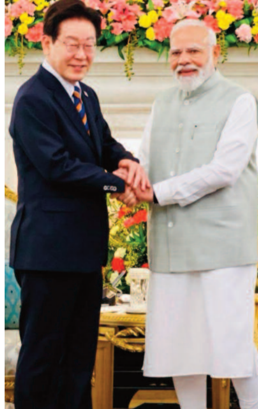
అలాగే ఇండో-పసిఫిక్ ప్రాంతంలో శాంతి, స్థిరత్వం కోసం రెండు దేశాలు కలిసి పనిచేస్తాయని మోదీ తెలిపారు.

న్యూఢిల్లీ, ఏప్రిల్ 20: భారత్, దక్షిణ కొరియా మధ్య ద్వైపాక్షిక సంబంధాలు మరింత బలపడుతున్నాయని ప్రధాని నరేంద్ర మోదీ అన్నారు. దక్షిణ కొరియా అధ్యక్షుడు లీ జే మ్యూంగ్ మూడు రోజుల పర్యటన కోసం భారత్ వచ్చారు. ఇరు దేశాల మధ్య సోమవారం పలు ఒప్పందాలు కుదిరాయి. అనంతరం నిర్వహించిన సంయుక్త మీడియా సమావేశంలో ప్రధాని మోదీ మాట్లాడారు. ఇరు దేశాల మధ్య ద్వైపాక్షిక సంబంధాల్లో ఇది కీలక ముందడుగు అని అన్నారు. భారత్, దక్షిణ కొరియా మధ్య సంబంధాలు కేవలం వాణిజ్యానికి మాత్రమే పరిమితం కాకుండా టెక్నాలజీ, రక్షణ, షిప్ బిల్డింగ్, ఎనర్జీ వంటి విభిన్న రంగాల్లో విస్తరిస్తున్నాయని ప్రధాని పేర్కొన్నారు. చివ్వు నుంచి షిప్స్ వరకు, టూలెంట్ నుంచి టెక్నాలజీ వరకు, ఎంటర్టైన్ మెంట్ నుంచి ఎనర్జీ వరకు... ఇలా వివిధ రంగాల్లోని అవకాశాలను అందిపుచ్చుకునే విధంగా దక్షిణ కొరియాతో భాగస్వామ్యం చేసుకుంటున్నట్లు తెలిపారు. ప్రస్తుతం ఇరు దేశాల మధ్య సుమారు 27 బిలియన్ డాలర్లుగా ఉన్న వాణిజ్యాన్ని 2030 నాటికి 50 బిలియన్ డాలర్లకు పెంచేందుకు చర్యలు తీసుకుంటున్నట్లు ప్రధాని తెలిపారు. ఈ సమావేశంలో పలు కీలక ఒప్పందాలు కూడా కుదిరాయి. ముఖ్యంగా పారిశ్రామిక రంగం, టెక్నాలజీ, ఎనర్జీ, క్రీటివ్ మినరల్స్ వంటి రంగాల్లో వరసరం సహకరించుకునేందుకు ఇరు దేశాలు అంగీకరించాయి.