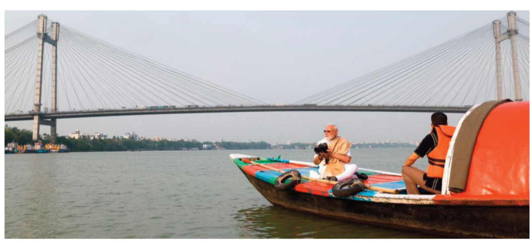
బెంగాల్ అభివృద్ధికి, ప్రజల శ్రేయస్సు కోసం తమ ప్రభుత్వం కృషి చేస్తుందన్నారు. హుగ్లీ నది ఒడ్డున తాను వెచ్చించిన సమయం చాలా ప్రత్యేకమైనదని మోదీ మరో

కోల్ కతా: ప్రధాని నరేంద్ర మోదీ పశ్చిమ బెంగాల్లో పర్యటిస్తున్నారు. శుక్రవారం కోల్ కతాలోని హుగ్లీ నదిలో బోట్ రైడ్ కు వెళ్లారు. ఈ సందర్భంగా కెమెరాను చేతపట్టి నది అందాలను క్లికమనిపించారు. దీనికి సంబంధించిన ఫోటోలను ఆయన ఎక్స్ లో పంచుకున్నారు. హుగ్లీ నది బెంగాల్ సంస్కృతిలో ముడిపడి ఉందని మోదీ పేర్కొన్నారు. బెంగాలీ జీవితాల్లో గంగానదికి ఒక ప్రత్యేక స్థానం ఉందని, దాని జలాలు ఒక ప్రాచీన నాగరికత స్ఫూర్తిని మోసుకెళ్లాయన్నారు. ఈ రోజు ఉదయం హుగ్లీ నది తీరంలో కొంత సమయం గడిపినట్లు వెల్లడించారు. ఈ క్రమంలో నదిలో పడవ నడిపేవారితో పాటు, ఉదయపు నడకకు వచ్చిన వారితో కాసేపు ముచ్చటించినట్లు తెలిపారు. పడవ నడిపేవారి శ్రామిక శక్తిని ఈ సందర్భంగా మోదీ కొనియాడారు. ఎన్నికల్లో గెలిపిస్తే.. పశ్చిమ