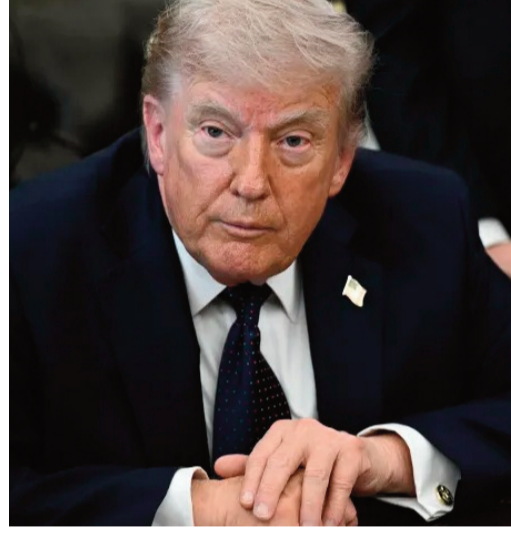
అణ్ణాయుధాలను వాడటానికి అనుమతించకూడదు" అని ఆయన కీలక వ్యాఖ్యలు చేశారు. ఇరాన్ తో తూతూమంత్రంగా కాకుండా, దీర్ఘకాలికంగా ఉండే బలమైన ఒప్పందంపైనే తన దృష్టి ఉందని ఆయన పేర్కొన్నారు. ఇరాన్ పాలకులకు

తక్కువ సమయం ఉందని హెచ్చరిస్తూ ట్రంప్ ఒక పోస్ట్ పెట్టారు. "నాకు చాలా సమయం ఉంది, కానీ ఇరాన్ కు లేదు. వారి నాయకత్వం బలహీనపడింది, సైన్యం చిన్నాభిన్నమైంది. మేము విధించిన ఆర్థిక, సైనిక దిగ్బంధనం అద్భుతంగా పనిచేస్తోంది. ఇక్కడ పరిస్థితి మరింత దారుణంగా ఉంటుంది" అని అందులో రాసుకొచ్చారు. హరూజ్ జలసంధిలో మైస్సె పెట్టి ఇరాన్ పెద్ద తప్పు చేసిందని ఆయన మండిపడ్డారు. ఇటీవల ఇరాన్ పతాకంతో ఉన్న ఒక వాణిజ్య నౌకను అమెరికా సీజ్ చేసిన ఉదంతంపై ట్రంప్ స్పందించారు. ఆ నౌకలో చైనా నుంచి ఇరాన్ కు వెళ్తున్న ఒక 'బహుమతి' ఉందని, అయితే అది అత్యంత రహస్యమైన విషయం కావడంతో వివరాలు వెల్లడించలేనని ఆయన సస్పెన్స్ రేపారు. మరోవైపు ఇజ్రాయెల్ - లెబనాన్ మధ్య కుదిరిన కాల్పుల విరమణను మరో మూడు వారాల పాటు పొడిగిస్తున్నట్లు ట్రంప్ ప్రకటించారు. ఇరు దేశాల నాయకులు త్వరలోనే వైల్డ్ హోస్ట్ సమావేశమై శాంతి చర్చలు జరిపే అవకాశం ఉందని వెల్లడించారు. మధ్యప్రాచ్యంలో శాంతి నెలకొనాలంటే ఇరాన్ తన పద్ధతి మార్చుకోవాలని ఆయన హితవు పలికారు.