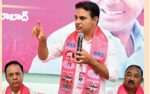
నాయకత్వ లక్షణాలను పెంపొందించేలా తరగతులు నిర్వహించాలని కేసీఆర్ దిశానిర్దేశం చేశారు.

అన్ని స్థాయిల కమిటీల రద్దుకు కేసీఆర్ ఆదేశం! కేటీఆర్ కు కీలక బాధ్యతలు.. త్వరలోనే కొత్త కమిటీల నియామకం