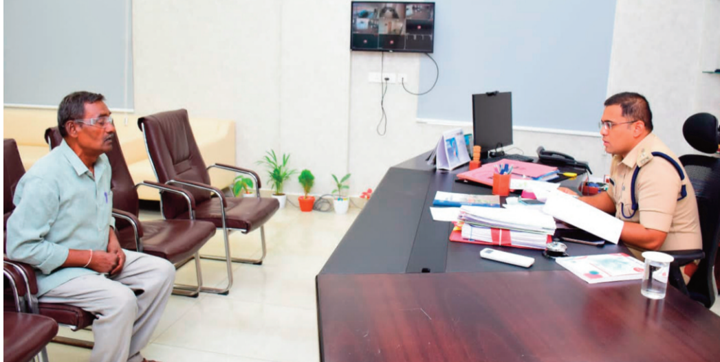
గ్రీవెన్స్ డే ద్వారా వచ్చే ప్రతి ఫిర్యాదును ఆన్ లైన్ లో పొందుపరుస్తున్నామని, వాటి పరిష్కార ప్రక్రియను ఎప్పటికప్పుడు సమీక్షిస్తూ సమర్థవంతమైన సేవలు అందిస్తామని ఆయన స్పష్టం చేశారు. నేరుగా అధికారుల దృష్టికి సమస్యలను తీసుకురావడం ద్వారా ప్రజలకు త్వరగా న్యాయం జరుగుతుందని ఎస్పీ వెల్లడించారు.

ప్రజానావ, సిరిసిల్ల: ప్రజల సమస్యలను నేరుగా విన్నవించుకునేందుకు, బాధితులకు సత్వర న్యాయం అందించే లక్ష్యంతో ప్రతి సోమవారం జిల్లా పోలీస్ కార్యాలయంలో గ్రీవెన్స్ డే కార్యక్రమం నిర్వహిస్తున్నట్లు ఎస్పీ మహేష్ బి.గిత్ తెలిపారు. సోమవారం జరిగిన ఈ కార్యక్రమంలో బాధితుల నుండి ఎస్పీ న్యాయంగా 19 ఫిర్యాదులను స్వీకరించారు. ఈ సందర్భంగా సంబంధిత పోలీస్ స్టేషన్ల అధికారులతో ఫోన్లో మాట్లాడి, బాధితుల సమస్యలను చట్టపరంగా త్వరితగతిన పరిష్కరించాలని ఆయన ఆదేశాలు జారీ చేశారు. పోలీస్ సేవలను ప్రజలకు మరింత చేరువ చేయడమే తమ ప్రధాన ఉద్దేశమని ఈ సందర్భంగా ఎస్పీ పేర్కొన్నారు. పోలీస్ స్టేషన్లకు వచ్చే ఫిర్యాదుదారులతో సిబ్బంది మర్యాదపూర్వకంగా ప్రవర్తించాలని, వినతులు స్వీకరించిన తర్వాత అవసరమైతే క్షేత్రస్థాయిలో విచారణ జరిపి బాధితులకు భరోసా కల్పించాలని సూచించారు.